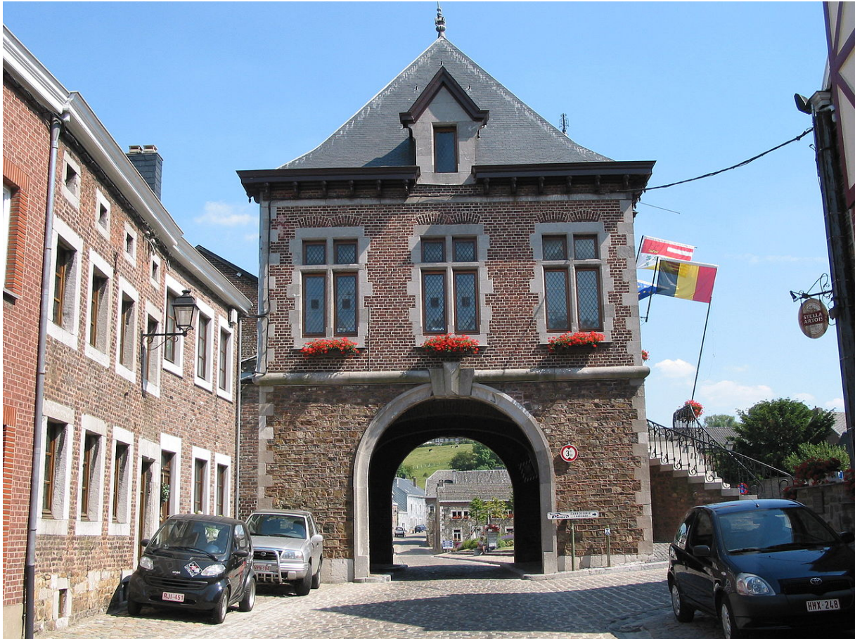
Voormalig stadhuis van Clermont.

In de richting van de chausseé Charlemagne aangekomen richting Henri-Chapelle sloeg Reinoud ten hoogte van Froidthier linksaf richting Clermont. Clermont of Clermont-sur-Berwinne (Nederlands: Klaerment ; Limburgs: Klaerment op Berwien ) is een plaats en deelgemeente van de Belgische gemeente Thimister-Clermont in de provincie Luik. Het dorp is opgenomen in de lijst van de mooiste plaatsjes in Wallonië (Les Plus Beaux Villages de Wallonie). Het zweet stond hem op