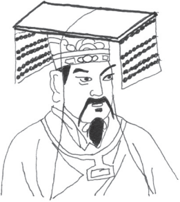
Gele Keizer? 2599 v.Chr.