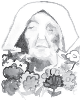
Oma Bé 1886-?