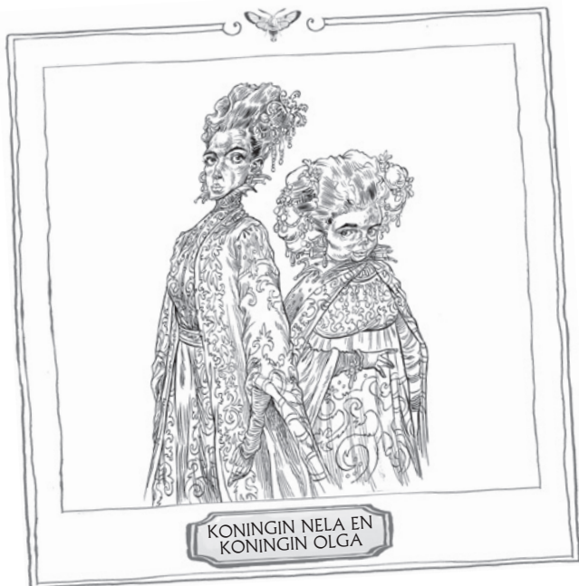
KONINGIN NELA EN KONINGIN OLGA