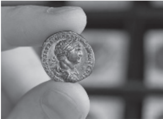
Zilveren denarius van de Romeinse keizer Trajanus, die heerste van 98-117, in de hand van de auteur.

Een paar decennia en talloze Romeinse munten later kan ik met een gerust hart stellen dat dat het moment was waarop mijn fascinatie voor munten begon. Dat waren immers van die hanteerbare vensters op een wereld die werd bevolkt door de meest kleurrijke en intrigerende personages, lieden die een welhaast goddelijke macht bezaten en tegelijkertijd behept waren met uitgesproken menselijke zwakheden. Een wereld zonder het geruststellende onderscheid tussen helden en schurken, waarin triomfen en tragedies gelijk opgingen – en het mooiste was dat het verhaal niet aan de verbeelding ontsproten was. Dit epos over opkomst en ondergang was waargebeurd, en de meest dramatische taferelen daaruit voltrokken zich onder je ogen in kostbaar metaal.