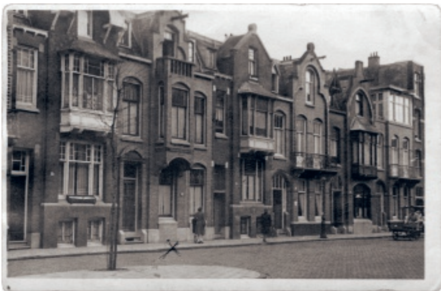
Het huis aan de Linnaeusparkweg, nummer 57 is met een kruisje aangegeven.

haar naam voortaan als 'Henny' te spellen. Een klein meisje dat heel gewenst was en vanaf het moment dat ze geboren werd het middelpunt van het gezin vormde.