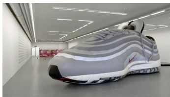
Het urinoir van Duchamp en een reuzeschoen in het Haus der Kulturen der Welt in Berlijn.