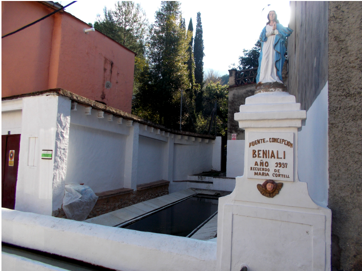
De bron van Benialí.

Benialí is het 'hoofddorp' van de vallei, want hier staat ook het gemeentehuis en het meestal gesloten bureau voor Toerisme. We vinden hier ook de lagere school voor de kinderen uit de vallei, die uit de andere dorpen met een bus worden gebracht.