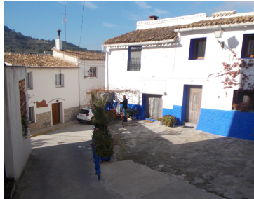
Straatjes in Benissivá

Benitaia verschijnt op documenten ook als Benitahar, Benitaher, Benitaer, Benitala f Beniyaya.