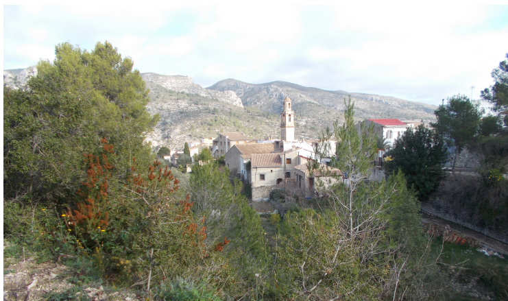
Boven La Carroja, onder Alpatró

We zien op oude documenten de plaats vermeld als Rachalosa, Caroja, Queroja, Carrocha of Carrosa. Ook hier vinden we het dorp voor het eerst op documenten uit 1369. De hoofdweg door de vallei liep vroeger door het dorp. Er zijn maar twee straten, maar vrij lange straten en een plein. De kerk, opgedragen aan San Francisco de Borja, staat aan het begin van het dorp vanaf de rijweg. In het dorp ligt de bron Font de Baix met zijn wasplaats.