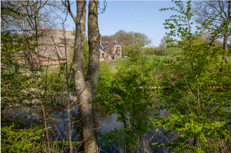
Enne Jans Heerd vanaf de overkant van het Mensingeweestersterloopdiep