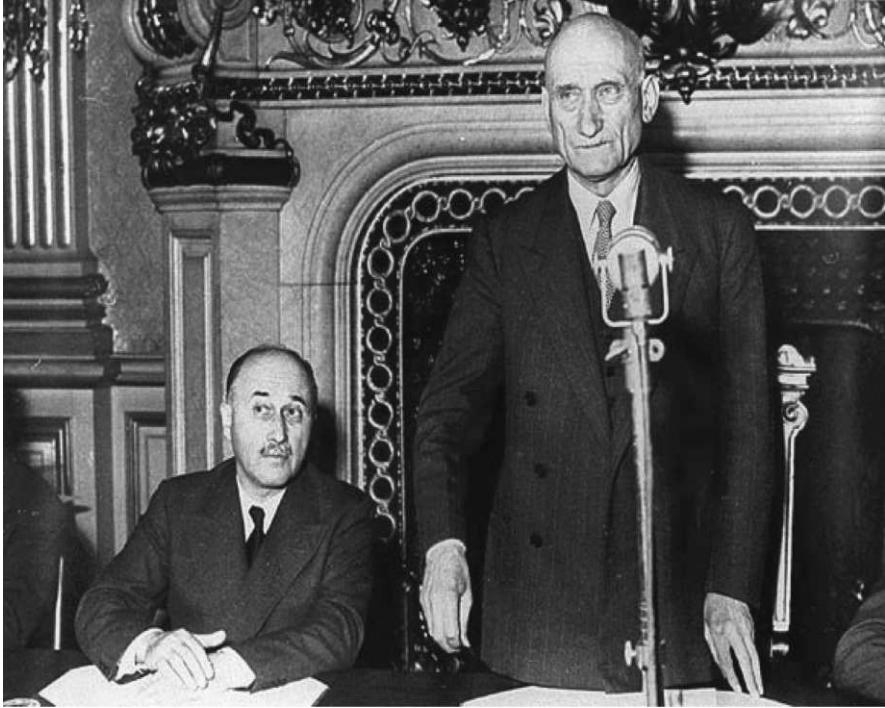
Robert Schuman legt op 9 mei 1950 zijn verklaring af, waarin hij de oprichting van de EGKS voorstelt. Hij gaf daarbij alle eer aan de ambtenaar die het plan had opgesteld (zeldzaam in de politiek), Jean Monnet (links)

De Europese integratie is het succesverhaal van na de Tweede Wereldoorlog, die het dieptepunt van de Europese geschiedenis vormt. De voormalige rivalen Frankrijk en (West-)Duitsland slaagden erin tot samenwerking te komen. Dit proces werd in de hand gewerkt door de nieuwe machtsverhoudingen in de wereld. De Verenigde Staten hadden de hegemonie in West-Europa verworven en stimuleerden met kracht het integratieproces in het kader van de 'Pax Americana'. Deze politiek werd ingegeven door de dreiging van de Sovjet-Unie.