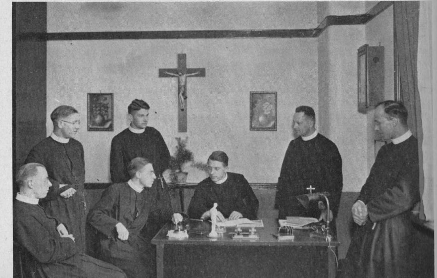
Afbeelding afkomstig uit: 'Fraters van Utrecht 1873 -1973'