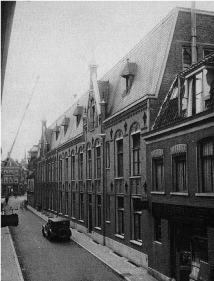
Het St. Gregoriushuis in Utrecht

Dit klooster was een onderwijscongregatie 2 van de: 'Fraters van de Congregatie van Onze Lieve Vrouw van het Heilig Hart.' In de wandeling worden zij ook wel de Fraters van Utrecht genoemd, naar de plaats waar de congregatie begonnen is.