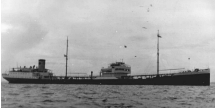
Mijn eerste ship. Het m.s. Murena, een 12.000-tons tanker

En met dit gegeven ben ik op het punt gekomen waar enkele herinneringen uit mijn vroege jeugd en mijn schooltijd eindigen. Ik kan beginnen met verhaal te doen over mijn belevenissen op de vijftwintig schepen waarmee ik bijna alle wereldzeeën heb bevaren.