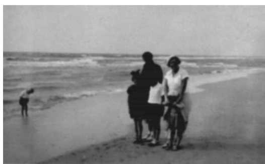
Niet bij de zee vandaan te slaan