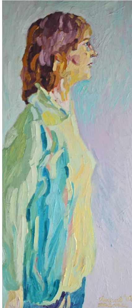
Wisje, olieverf op paneel, Victor Emanuel, 2012 De tweede vrouw van Victor Emanuel.