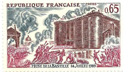
Bestorming van de Bastille. Zegel ontworpen door Albert Decaris (1971).