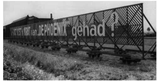
vanuit de trein halverwege

gewapend met emmertjes en schepjes lopend naar de Spuistraat vanwaar de Blauwe Tram op breedspoor vertrok o o o wat deed hij er lang over we noemden hem de trammetrein vaak kwam pappa dan 's avonds na zijn werkdag naar ons toe