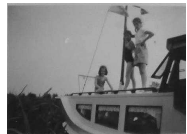
Diezelfde boot en mensen, groter wel er op

een zoontje van de claviger raakte regelmatig te water of hij het was of een ander mijn moeder ziet het gebeuren en vliegt het huis uit om zich in het water te laten zakken wat had ze moeten beginnen ze had een kokerrok een gelukkig een man recht tegenover halfnaakt stond zich te scheren en snelt toe en redt hem