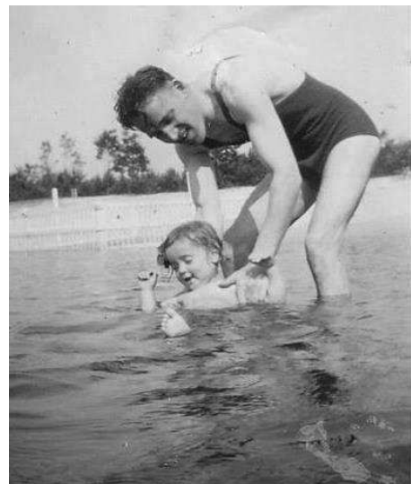
men zei een moederskindje, zo duidelijk een vaderskindje