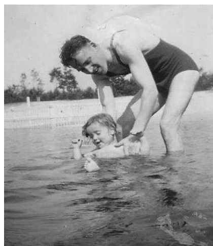
men zei een moederskindje, zo duidelijk een vaderskindje

ze heeft een konijn gebreed door een tante haar lievelingsknuffel konijn Abeldijn ze krijgt een neefje en moet hem weggeven dat is leuk zegt de moeder het is ook zijn tante die hem gebreed heeft