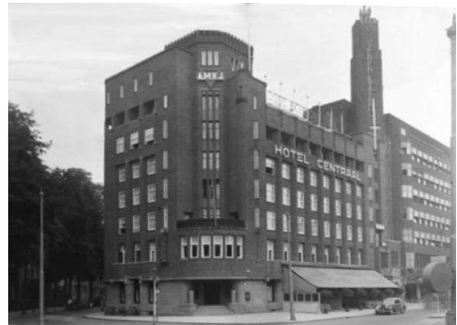
Mijnheer Burksen werkte in het restaurant