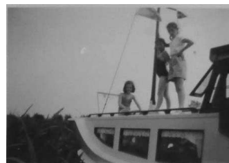
Diezelfde boot en mensen, groter wel er op

een zoontje van de claviger raakte regelmatig te water of hij het was of een ander mijn moeder ziet het gebeuren en vliegt het huis uit om zich in het water te laten zakken wat had ze moeten beginnen ze had een kokerrok een gelukkig een man recht tegenover halfnaakt stond zich te scheren en snelt toe en redt hem