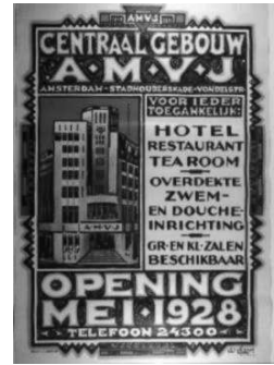
Wat ik nog leren kan van het A.M.V. J. toen in gebruik als kleine sjoel

weg wil ze weg weg van al die kijkende mensen