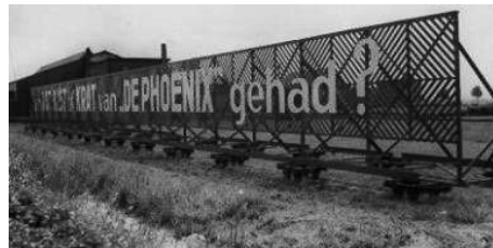
vanuit de trein halverwege

gewapend met emmertjes en schepjes lopend naar de Spuistraat vanwaar de Blauwe Tram op breedspoor vertrok o o o wat deed hij er lang over we noemden hem de trammetrein vaak kwam pappa dan 's avonds na zijn werkdag naar ons toe