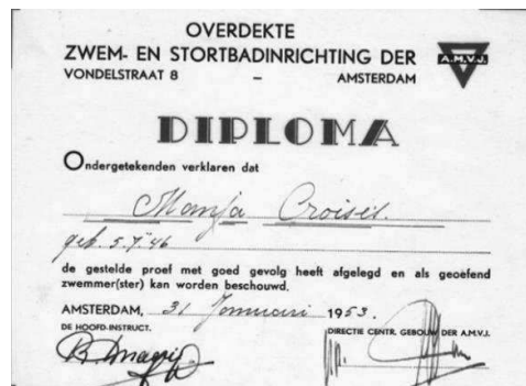
Diploma 6 jaar oud, wat een vreemde datum.