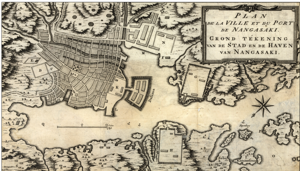
Afbeelding 2: Plattegrond van de stad Nagasaki met in de haven het kunstmatige eiland Dejima.

gebonden was aan een klein kunstmatig eilandje voor de kust van Nagasaki, genaamd Dejima, floreerde de handel er volop, met name de eerste decennia. Weliswaar waren de klimatologische omstandigheden in Nagasaki doorgaans veel beter dan bijvoorbeeld in Indonesië, toch stierven er velen, met name degenen die op de talloze handelsschepen rond augustus-september van elk jaar aanmeerden. Want ook de reis vanuit de Nederlandse koloniën in het toenmalige Nederlands-Indië was gevaarlijk en tropische ziekten lagen op de loer. Op Dejima was er aanvankelijk geen mogelijkheid om te begraven en moesten de Nederlanders hun doden enkele mijlen uit de kust aan de zee toevertrouwen, maar in 1655 kregen ze voor het eerst toestemming om een dode 'aan de andere kant van de baai' te begraven. Deze gebeurtenis zou leiden tot wat nu bekend staat als de Hollandsche begraafplaats.