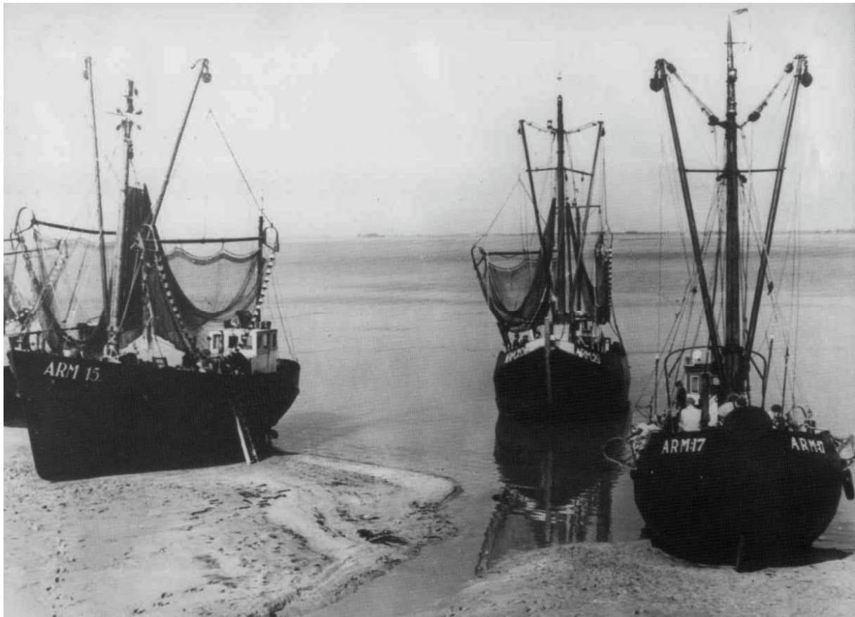
De ARM 17 (rechts) in 1959, op het strandje, bij de Veerse Toren te Veere, waar zij meestal lagen voor een goede schoonmaak en een nieuwe verflaag.