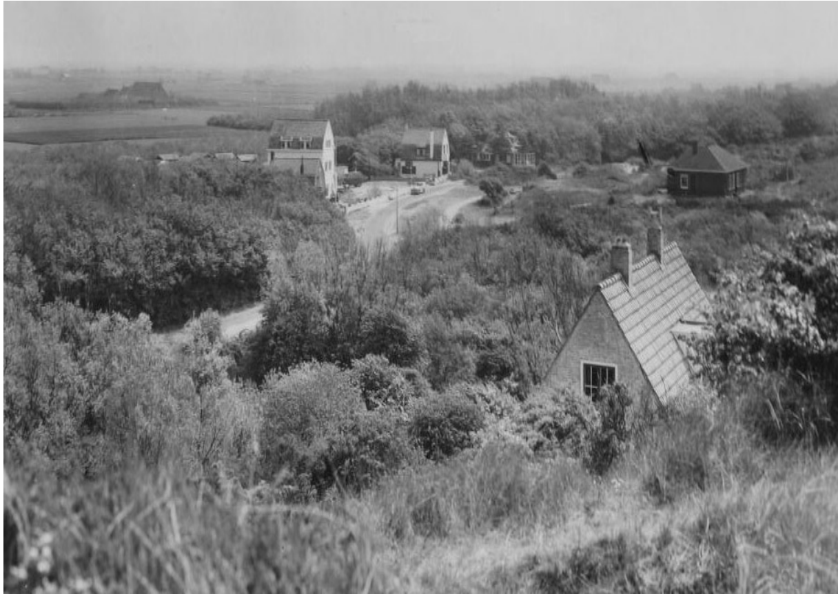
Cafetaria Duinoord – 1959 (in 1975 gesloopt). Toen nog zonder de Botterbar..