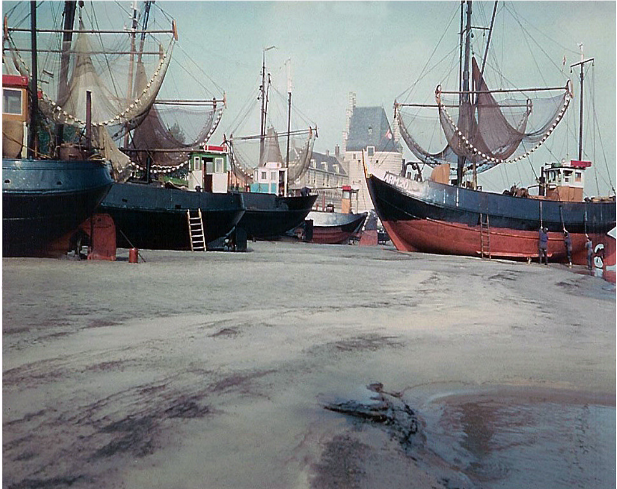
Hier een mooi overzicht van het strandje bij de Veerse Toren.