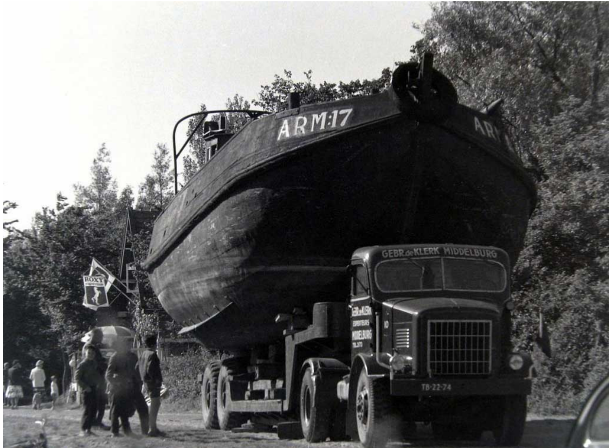
De ARM 17 vlakbij Cafetaria Duinoord op de Duinweg te Zoutelande.