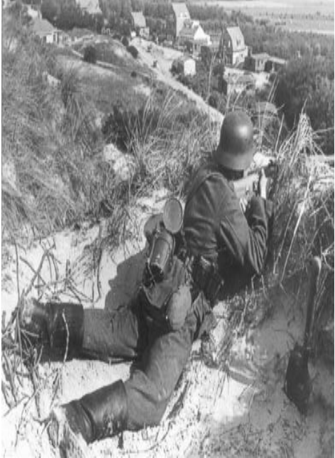
1942 met Victoria op de achtergrond.