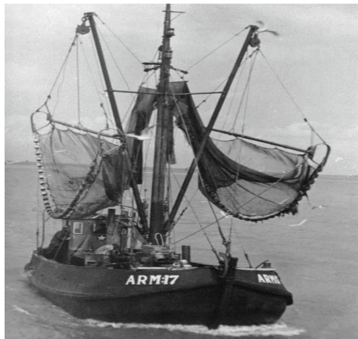
De ARM 17 op het Veerse Meer.