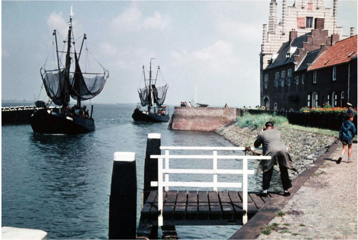
De ARM 9 voerde Veere binnen.