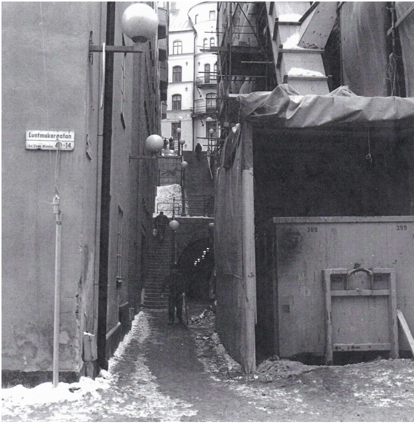
Tunnelgatan daags na de moord. De dader rende langs het bouw materiaal en beklom de trappen naar Malmskillnadsgatan.

De moordenaar rende de 89 traptreden naar Malmskillnadsgatan op. Ondanks het winterweer was de trap schoon en niet glad. Bovenaan keek hij over zijn schouder naar beneden en zette zijn weg voort.