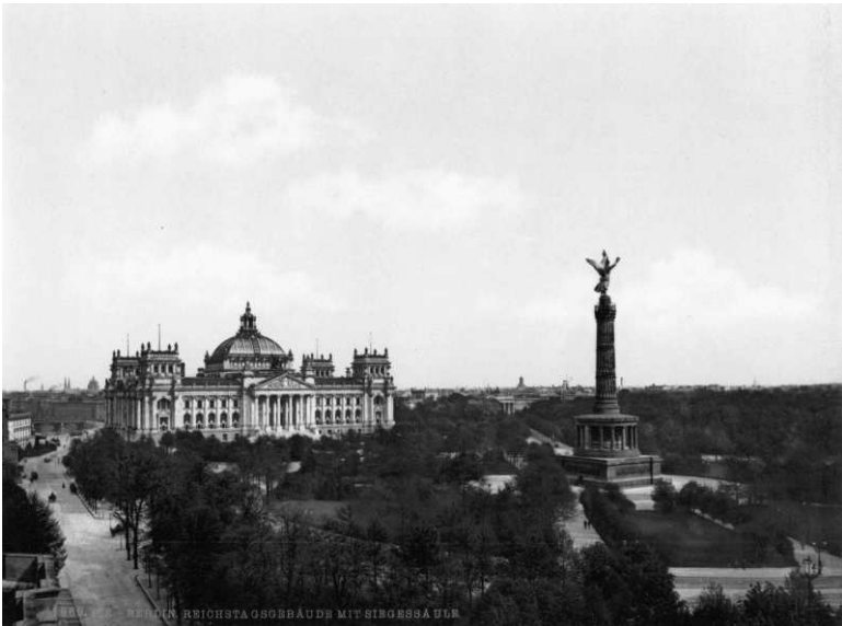
De Siegestsäule in het park Tiergarten en de Rijksdag omstreeks 1900.

De Zoologischer Garten Berlin bevindt zich op de grens van twee door toeristen graag bezochte gebieden in het westen van de Duitse hoofdstad. Ten zuiden ervan bevindt zich het levendige winkelgebied van Charlottenburg met de brede boulevard Kurfürstendamm als bruisend middelpunt. Trekpleister is het befaamde warenhuis Kaufhaus des Westens (KaDeWe) aan de Tauentzienstraße 21-24, dat gedurende de tweedeling van Berlijn met rijkelijk gevulde etalages als baken diende van het kapitalistische Westen. In vergelijking hiermee is het gebied ten noorden van de zoo een oase van rust. Hier ligt, aan de zuidoever van de Spree, de Großer Tiergarten, het grootste park van de stad waar op zonnige dagen volop gerecreëerd wordt onder het bladerdak en aan de oevers van meertjes.