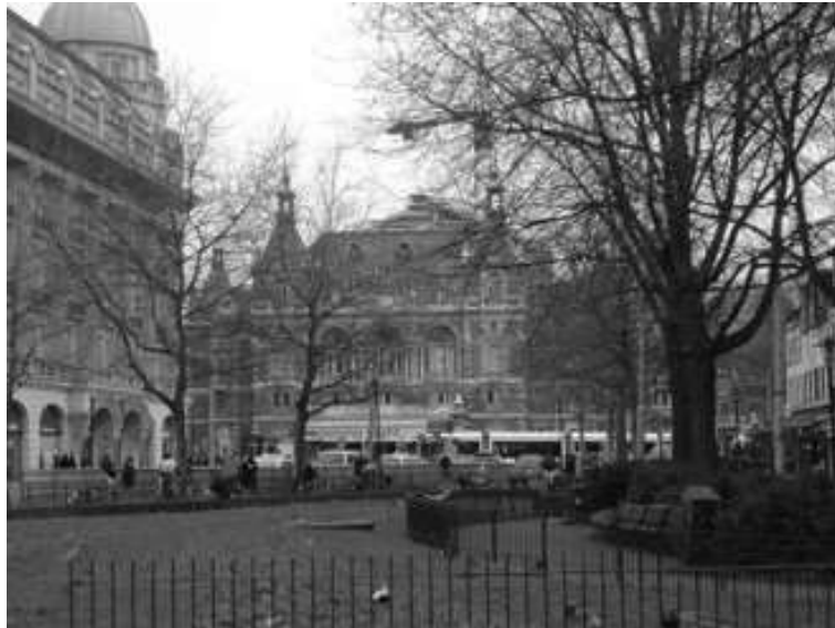
Een foto vanuit ons huis, Lijnbaansgracht 250 I, Amsterdam.

De ongewenste baby uit een depressieve moeder, het stille kindje, haast onzichtbaar de goede leerling, het knappe balletmeisje, maar altijd was er die mysterieuze angst... die veel later manifest zou worden, decennia verder begreep ik pas waarom.