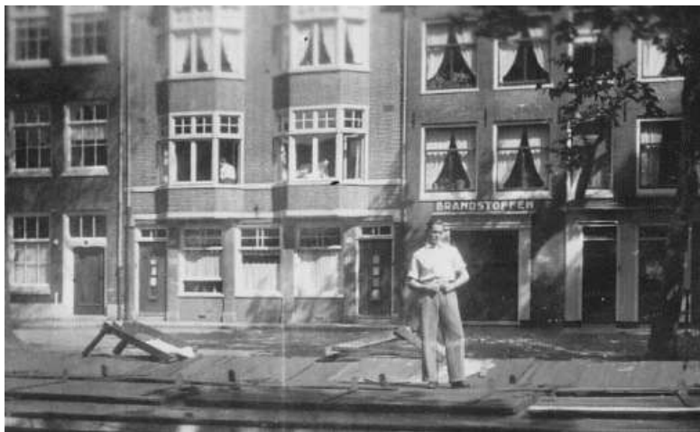
HET HUIS WAAR IK GEBOREN BEN.

Wat een vreemd idee, het ziet er zo rustig en vredig uit. De oorlog was voorbij. Als oorlog, maar niet voor de slachtoffers, onvoorstelbaar de man in de linker erker, mijn vader 31. Hij had jaren KZ achter de rug, mijn moeder 28 en wel haar man en kinderen, maar de rest heeft de SHOAH niet overleefd. Opeens klinkt Manja en klinieken meer dan logisch