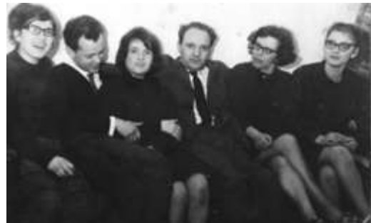
Wierden Maart 1964 vanuit Stuttgart, Amsterdam en Zeist.

te geven maar ik sliep als een roos. 'ik kan zonder' "heeft dokter dat gezegd?" 'Nee.' Neus dicht pil naar binnen.