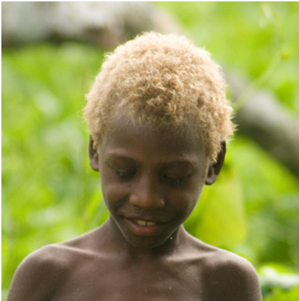
Afbeelding 3: Zwarte jongen met blond kroeshaar