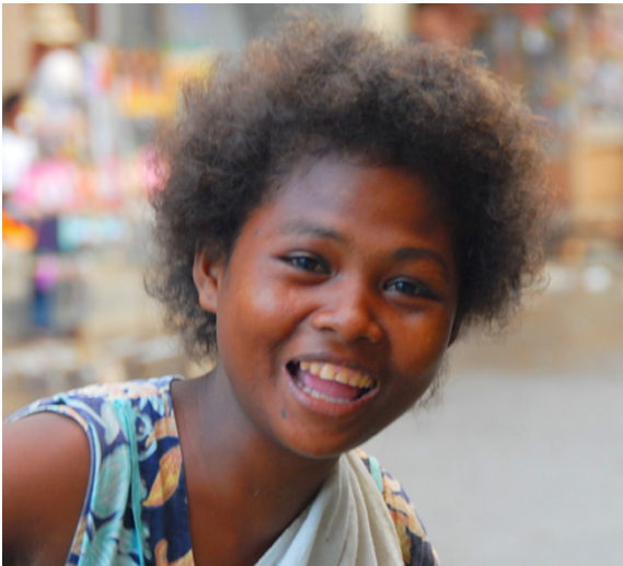
Afbeelding 1: Negrito vrouw uit de Filipijnen.

Er is nu eindelijk een kentering in het denken gekomen van gekleurde mensen over kroeshaar. Er is nu een stap gezet om het negatieve juk van zich af te schudden van een eeuwenlange miskenning van het eigen haar.