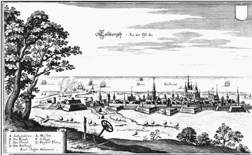
Kolberg in 1652, getekend door Matthäus Merian.