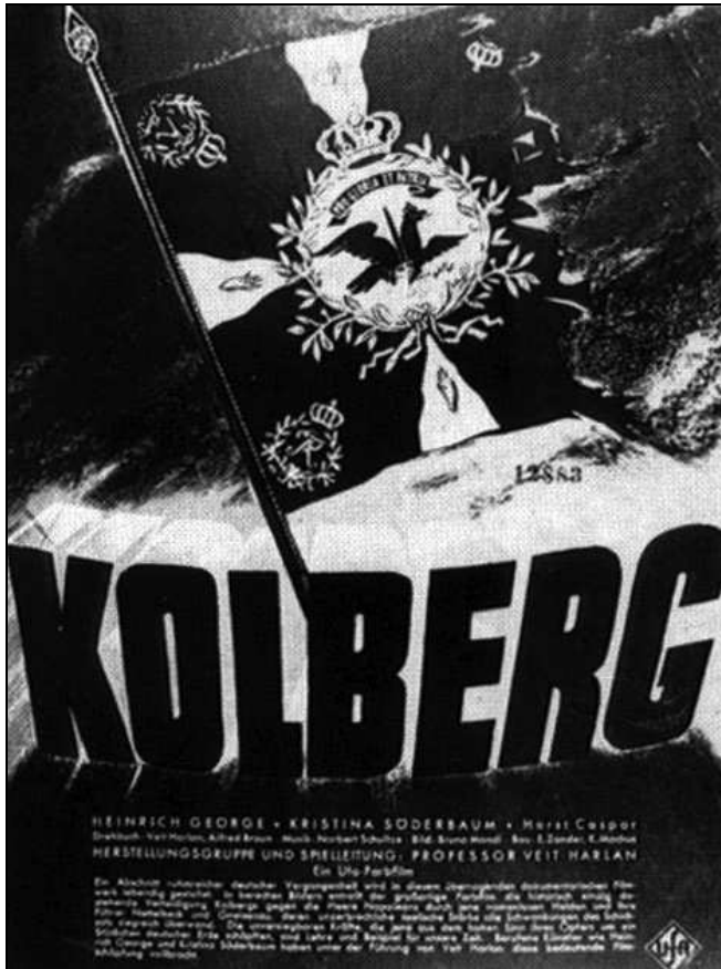
Filmposter uit 1945.

De film 'Kolberg' was een cinematografisch hoogtepunt voor de nazi-cinema. Kosten noch moeite werden gespaard om de film te maken. Het was een productie waarop de invloed van Joseph Goebbels groter dan ooit was. Hoewel hij niet in de openingstitels werd genoemd, was hij in feite de producent en medescriptschrijver. Bekijk je tegenwoordig de film, dan kun je je voorstellen dat deze voor de kijkers van toen een opzweepende werking kan hebben gehad. Op het moment van verschijnen was het echter veel te laat. 'Een gevoel van verlatenheid en ijzige kou', zou de film volgens een kijker slechts nog opgeroepen hebben. 16 Terwijl 'Das Boot' genoemd kan worden als één van de succesvolste Duitse filmproducties, kan 'Kolberg' gezien worden als de grootste mislukking. De film had gedurende de laatste oorlogsmaan-