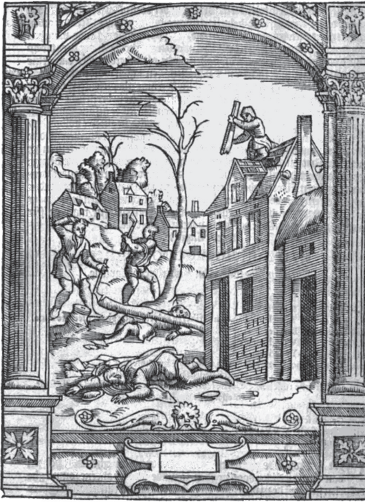
Zestiende-eeuwse afbeelding van doodslag zonder opzet.

verdeelden het rijk. Knut kreeg het noorden en Edmund het zuiden, met de Thames als grens. Na de onverwachte dood van Edmund werd Knut, overeenkomstig het vredesverdrag, koning van heel Engeland.