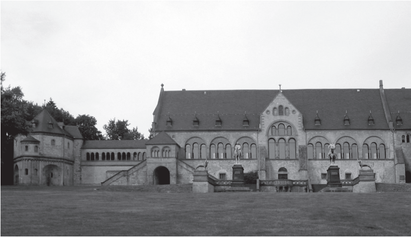
De grotendeels herbouwde keizerlijke residentie in Goslar, een monument ter ere van het trotse Duitse verleden.

van nationaalsocialisten tot held van het Eerste Rijk werd verheven. In de nasleep van de Tweede Wereldoorlog beschouwden de communisten van de DDR de opstandige Saksen uit de negende eeuw, die we in dit boek als Stellinga zullen tegenkomen, als kameraden die het juk van de Frankische overheersers – lees: het kapitalistisch imperialisme – hadden afgeschud.