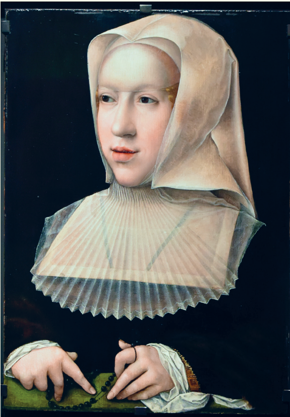
Margaretha van Oostenrijk (1480-1530), hertogin van Savoye. Olieverf op paneel, Bernard van Orley, zestiende eeuw (Monastère royal de Brou).

zelf te regeren, dus zijn vader Maximiliaan trad op als regent. Maximiliaan en de vorsten die na hem regeerden, maakten de Nederlanden tot onderdeel van hun grotere Habsburgse bezit. Internationale en dynastieke belangen kregen voorrang. In 1494 droeg Maximiliaan, inmiddels keizer van het 'Heilige Roomse Rijk', het bestuur over de Nederlanden over aan Filips de Schone. Die trouwde in 1496 met Johanna, dochter en erfopvolgster van de 'Katholieke Koningen' Ferdinand en Isabella van Aragon en Castilië. Zo ontstond de connectie met Spanje. Filips de Schone werd in 1506 koning van Castilië maar overleed datzelfde jaar. Keizer Maximiliaan trad weer op als regent, nu voor Filips' zoontje Karel, en Maximiliaans dochter Margaretha werd landvoogdes. Het op de Habsburgse belangen gerichte bestuur van Maximiliaan en Margaretha riep weerstand op, en de Nederlandse gewestelijke vertegenwoordigers reageerden opgelucht toen de jonge Karel in 1515 meerderjarig werd verklaard. Karel ging even later ook regeren als koning van Spanje, en in