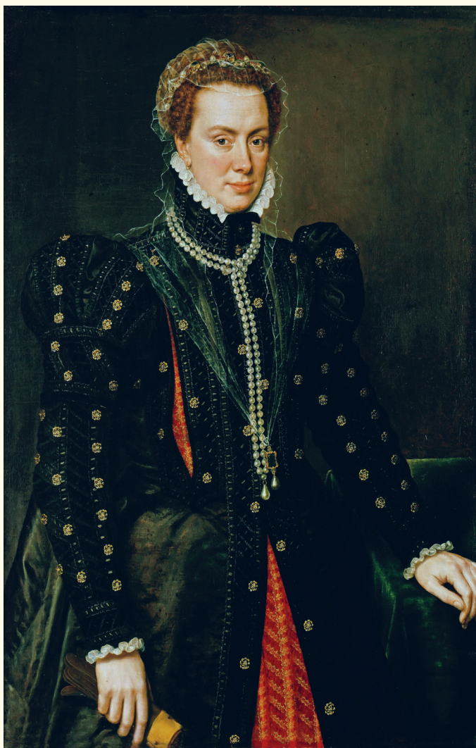
Margaretha van Oostenrijk (1522-1586), hertogin van Parma en Piacenza. Olieverf op doek, A. Mor, 1562 (Gemäldegalerie, Berlijn).

De aftocht van de kardinaal zorgde er niet alleen voor dat de hoge adel weer een grotere stem kreeg, maar tevens dat de gelederen van de hierdoor bemoedigde calvinisten werden versterkt. Velen in de Lage Landen, ook de nog steeds overgrote meerderheid van katholieken, keurden al te hardvochtig optreden tegen hervormingsgezinden af. De Prins van Oranje sprak zich er