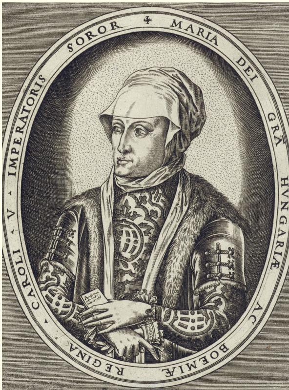
Maria (1505-1558), koningin van Hongarije en Bohemen, zuster van Karel V. Gravure FransHuys, zestiende eeuw (Rijksmuseum, Amsterdam).

Onder Karel V werden ook de laatste van de 'Zeventien Provinciën' onder Habsburgs bestuur gebracht: Friesland, Overijssel, Groningen en Drenthe, Utrecht en ten slotte (in 1543) Gelre en Zutphen. Alleen het prinsbisdom Luik bleef buiten de Habsburgse Nederlanden, die Karel V graag nog wat zou hebben uitgebreid in noordoostelijke richting. De uitbreiding bleef echter beperkt tot het graafschap Lingen. In 1548 maakte Karel de Nederlanden, samengebracht in de zogenaamde 'Bourgondische Kreits' (of Kring), nog losser van het Heilige Roomse Rijk, en een jaar later regelde hij in de Pragmatieke Sanctie de erfopvolging. Alle gewesten zouden in de toekomst verenigd blijven onder één en dezelfde vorst. Karels zoon Filips werd erkend als de eerste van die opvolgers.