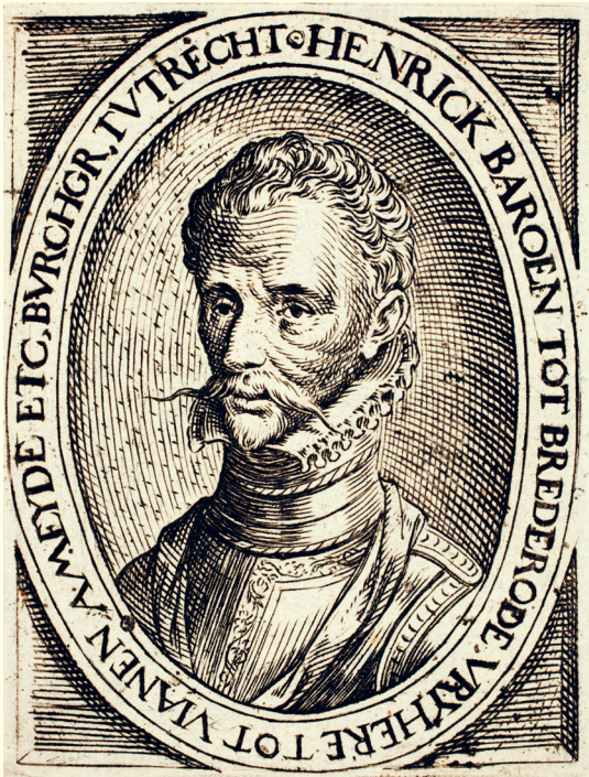
Hendrik van Brederode (1531-1568). Illustratie in: P.C. Bor, Oorspronck, begin ende vervolgh der Nederlantsche oorlogen , deel 1, Leiden/Amsterdam, zeventiende eeuw (Bibliotheek Vredespaleis, Den Haag).

De reactie in de Nederlanden op de koninklijke 'brieven uit het bos van Segovia' was dramatisch. De markies van Bergen en de Prins van Oranje wilden hun publieke ambten uit protest neerleggen, en andere hoge edelen distantiëerden zich eveneens van het koninklijk bestuur. De landvoogdes verzocht allen met nadruk om toch vooral aan te blijven. Onder leiding van Hendrik van Brederode en Lodewijk van Nassau, een broer van Willem van Oranje, keerden ruim 400 meest lagere edelen zich in een 'Compromis' (of 'Eedverbond') tegen de inquisitie en maatregelen tegen ketterij, vervat in regeringsordinanties, de zogenoemde 'plakkaten'. Het Eedverbond telde een aantal protestanten, onder wie de voornaamste leiders Brederode en Lodewijk van Nassau, maar de meerderheid was rooms-katholiek.