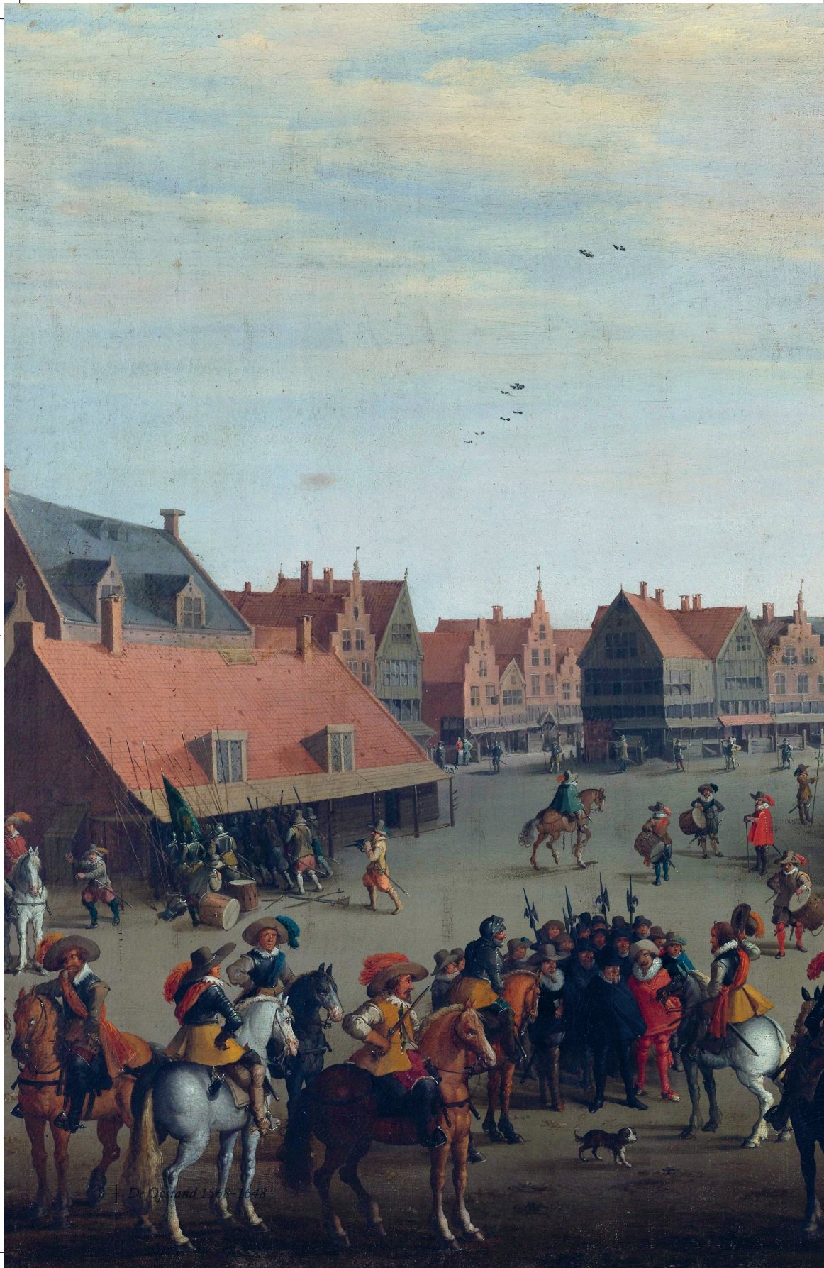
3 | De Opstand 1568-1648