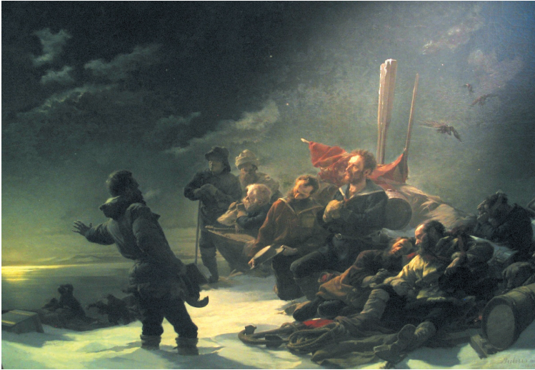
Schilderij van Julius Payer, 1892. Heeresgeschichtles Museum, Wenen. Een van de leiders van de Oostenrijks-Hongaarse poolexpeditie was Julius Payer, de schilder van het doek. De expeditie kwam langdurig vast te zitten in het ijs. Terug in Wenen kreeg de expeditie een heldenontvangst.

van Rusland nog altijd bekend als Frans Jozefland, ter herinnering aan keizer Frans Jozef (1848-1916).