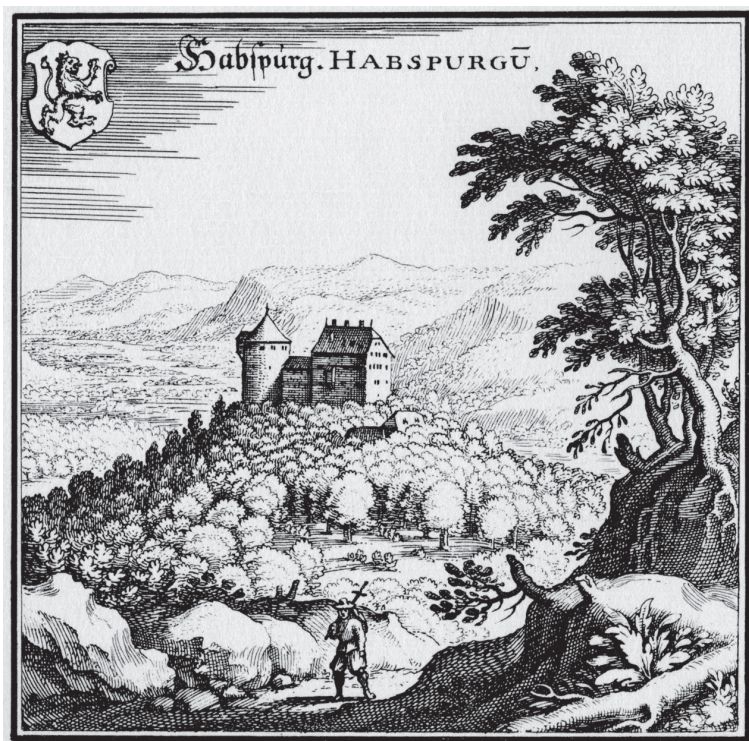
Gravure van Matthäus Merian, 1642. Uit de Topographia Helvetiae , 1642. Aan de rivier de Aar in het Zwitserse Aargau bouwden zo rond het jaar 1020 graaf Radboud van Klettgau en zijn broer Werner, de latere bisschop van Straatsburg, deze 'haviksburcht' op de Wülpelsberg.

bijkans denigrerende betekenis, omdat deze herinnerde aan een provinciaals verleden dat men achter zich had gelaten. Toen rond 1415 keizer Sigismund hertog Ernst van Oostenrijk aansprak als 'Heer van Habsburg', vatte deze dat dan ook op als een belediging en sprak de keizer vervolgens aan als 'Heer van Luxemburg'. Pas in het begin van de negentiende eeuw kwam de naam Habsburg weer in omloop, deels als gevolg van Schillers populaire ballade Der Graf von Habsburg (1803).