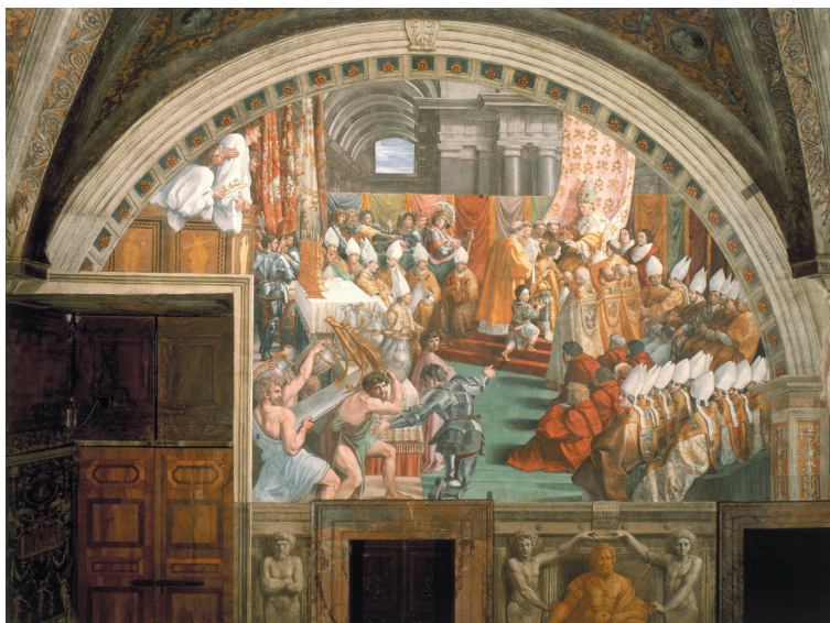
Fresco van Rafaël, 1514. Musei Vaticani, Vaticaanstad.

De keizerkroning van Karel de Grote in 800 maakte hem patronus et advocatus van de katholieke kerk. De eenheid tussen kerk en staat werd onder meer gesymboliseerd toen Karel de banier van Rome en de sleutel van het Heilig Graf in Jeruzalem ontving.