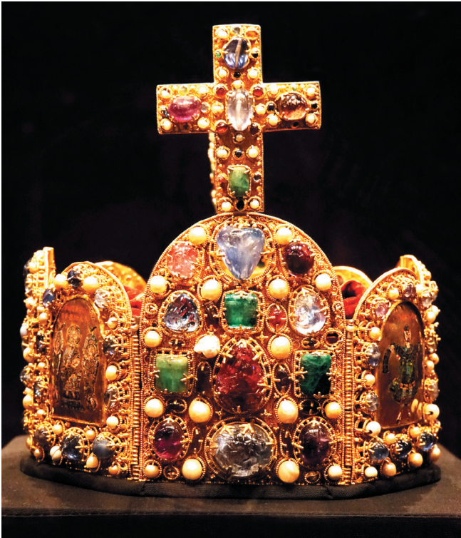
De kroon van het Heilige Romeinse Rijk.