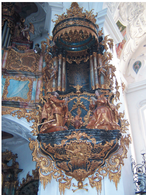
Klosterkirche, Muri. Het gedenkmonument in de Kloosterkerk van de abdij van Muri, ter herinnering aan graaf Radboud: de grond- legger van de dynastie van de Habsburgers.

Vanaf het moment dat ze in de geschiedenis opduiken, vormden de Habsburgers een illustere familie. In de tiende eeuw verwierven hun voorouders zich een wisselende reeks heerlijkheden