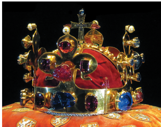
De Wenceslas kroon van Bohemen.