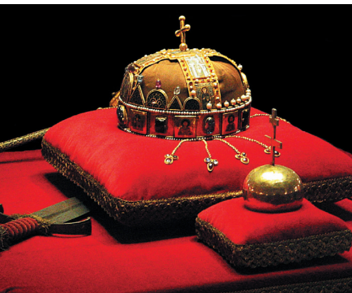
De Hongaarse kroon.