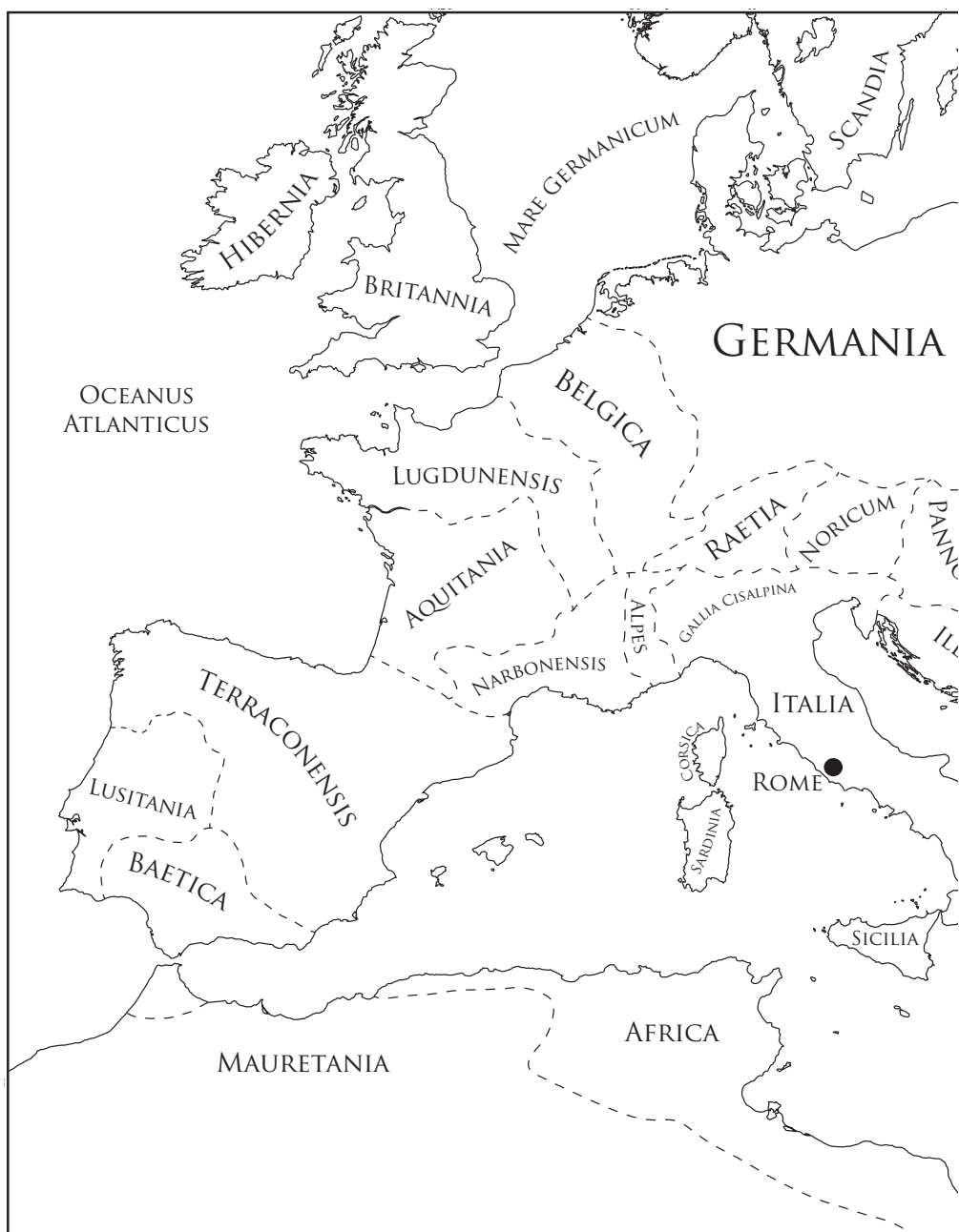
Kaart 1: Het Romeinse Rijk ten tijde van keizer Augustus, rond 12 v.Chr.