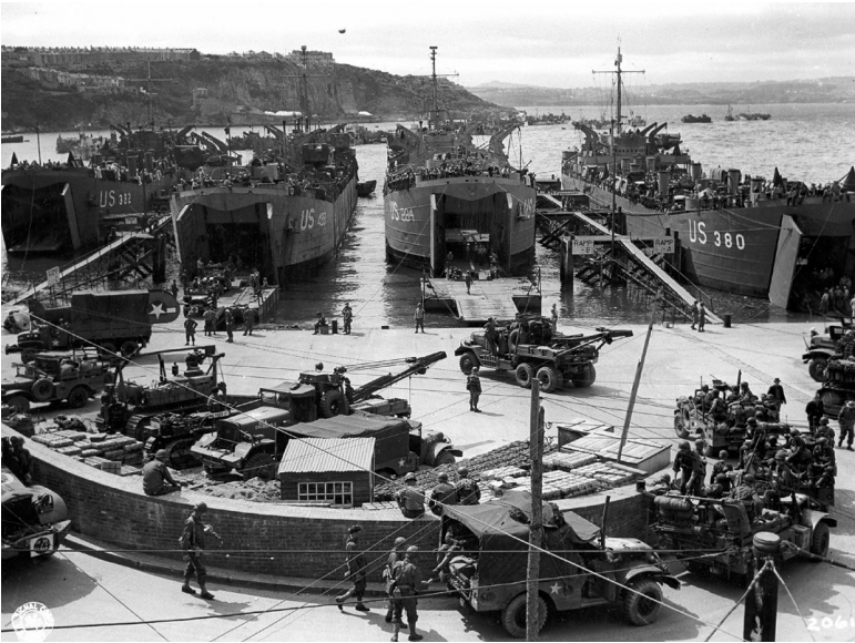
Inschepping in LST's in de haven van Brixham op 1 juni 1944.

de Joegoslavische jurist Dušan 'Duško' (Tricycle). Zo succesvol zou Fortitude South uitpakken, dat de Duitsers tot in augustus 1944 een tweede landing op de stranden langs het Nauw van Calais verwachtten en voor die eventualiteit troepen vasthielden die in Normandië dringend benodigd waren.