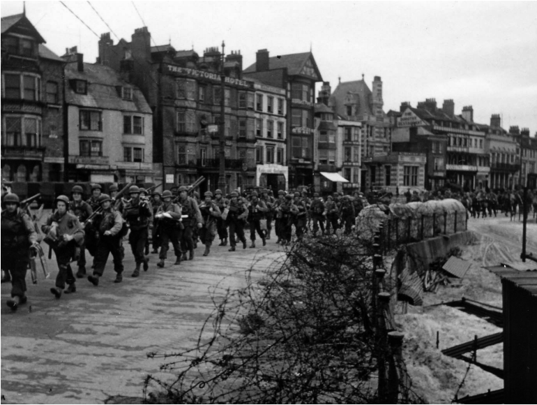
Amerikaanse troepen marcheren af om zich in te schepen voor de invasie.

Winston Churchill is de uitspraak: ‘In oorlogstijd is de waarheid zo kostbaar, dat ze altijd omringd moet zijn door een lijfwacht van leugens.’) De operatie viel in twee delen uiteen. Fortitude North, dat de indruk moest wekken dat de geallieerden een invasie in Noorwegen planden, en Fortitude South, dat de Duitsers in de waan moest brengen dat het Nauw van Calais het doelwit vormde. In deze misleidingscampagne waren de belangrijkste instrumenten radioverkeer tussen fictieve eenheden in het zuidoosten van Engeland (de Amerikaanse 1 e Legergroep) en dubbelspionnen. De Britse contraspionage had alle Duitse geheime agenten in het Verenigd Koninkrijk ontmaskerd; velen van hen werden omgeturnd en stuurden valse informatie naar de inlichtingendienst Abwehr . De belangrijkste drie dubbelspionnen werkten echter met hart en ziel voor de geallieerde zaak: de Spanjaard Juan Pujol (codenaam Garbo), de Poolse officier Roman Garby-Czerniawski (Brutus) en