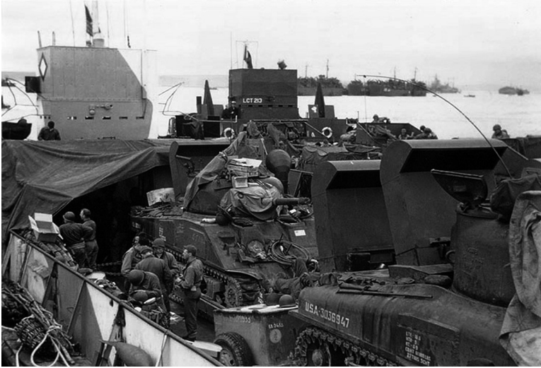
Tankeenheid van de 1 st Infantry Division wachtend op vertrek.

Dwight D. Eisenhower (Ike) werd in november '43 benoemd tot opperbevelhebber van de geallieerde expeditionaire macht; de Britse generaal Bernard Montgomery zou tijdens de invasie de landstrijdkrachten aanvoeren. Het plan van COSSAC werd overgenomen en uitgebreid. De eerste blauwdruk voorzag een landing door drie infanteriedivisies en twee luchtlandingsbrigades. In versie 2.0 landden er vijf divisies op evenzovele stranden – van west naar oost aangeduid met de codenamen Utah, Omaha, Gold, Juno en Sword en samen zo'n honderd kilometer breed – voorafgegaan door drie luchtlandingsdivisies voor de flankbeveiliging. Twee hiervan waren Amerikaans, de 82 nd en 101 st Airborne, en hun opdracht was het om op het schiereiland Cotentin de uitvalswegen vanaf Utah Beach plus strategische objecten te veroveren, en tevens Duitse artillerie die op de stranden kon vuren te vernietigen. De missie van de Britse 6 th Airborne Division, die ten oosten van de Orne zou landen, omvatte het nemen van deze en opblazen van gene bruggen, uitscha-