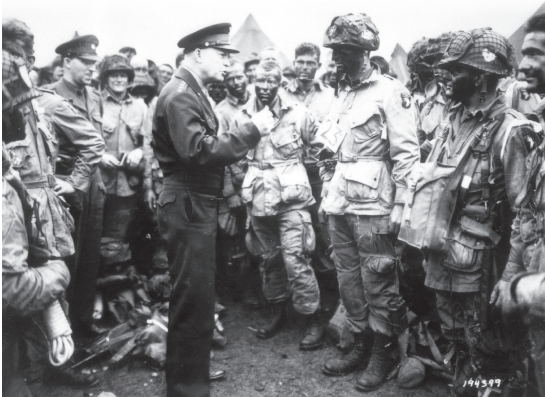
Generaal Eisenhower zwaait parachutisten van de 101 st Airborne Division uit.