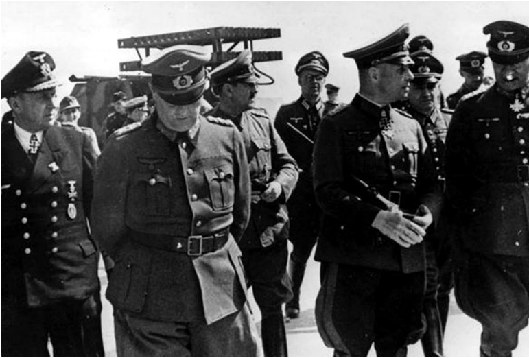
Rommel (tweede van rechts) op bezoek bij de 21. Panzer-Division.

kelen van een kustbatterij en het afslaan van tegenaanvallen. De juiste datum waarop in juni de invasie zou plaatsvinden – men had die in mei willen uitvoeren, maar toen waren er nog onvoldoende landingsvaartuigen beschikbaar – werd mede bepaald door de getijden en de Duitse verdedigingswerken. Verkenningsvliegtuigen namen continu foto's van de Normandische kust, en die onthulden dat de Duitsers hard bezig waren met de aanleg van nieuwe artilleriestellingen en een variatie aan hindernissen in het intergetijdengebied, veel ervan gemineerd. Vond de landing plaats bij vloed, als ze onder water en onzichtbaar waren, dan zou dat legio landingsvaartuigen kosten. Wordt deze bij eb uitgevoerd, dan moesten de troepen een drie- tot vierhonderd meter breed strand oversteken, onder vijandelijk vuur. Dit laatste werd echter het minst bezwaarlijk geacht en kon deels worden ondervangen door de infanterie vooraf te laten gaan door tanks. Dus viel het besluit om kort na de laagste waterstand te landen en dan de obstakels meteen te laten ver-