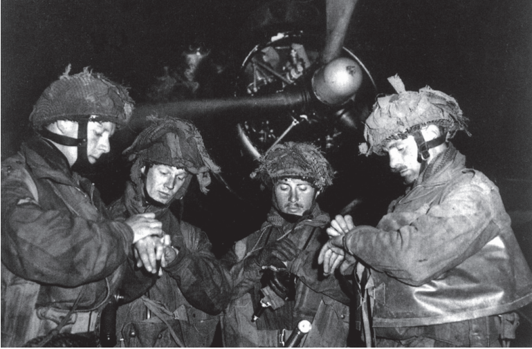
Britse para's zetten hun horloges gelijk voor aanvang van de operatie.