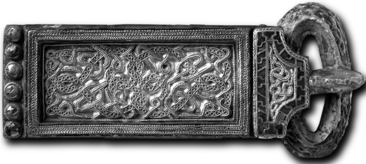
Versierde riemgesp uit het grafveld Rijnsburg-De Horn.

We kunnen uit de rijke archeologische vondsten in ons kustgebied de opkomst van een bezittende klasse afleiden. Er ontstond een bovenlaag van aristocratische clans die overzeese contacten onderhield met de heersende elites van de prille Germaanse koninkrijken die in de vijfde en zesde eeuw rond de Noordzee opkwamen.