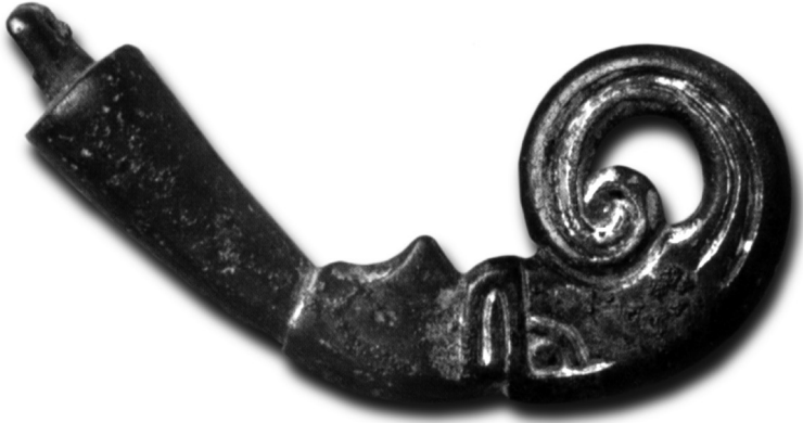
Verguld bronzen uiteinde van een drinkhoorn uit het grafveld Katwijk-Klein Duin.

van kostbare geschenken breed uitgemeten als een feestelijke, met drank overgoten gebeurtenis in grote zalen waar de machtigen zitting hielden en hun gasten ontvingen. Het verguld bronzen uiteinde van een drinkhoorn in de vorm van een vogelkop dat in het grafveld Katwijk-Klein Duin werd gevonden, past prachtig in dit beeld. 4