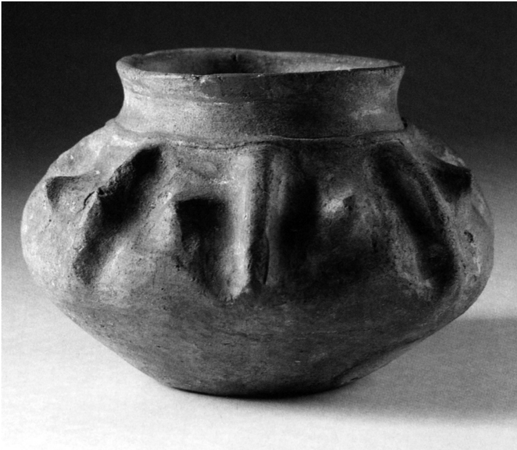
Angelsaksisch aardewerk met typerende knobbelversiering.

bekend is uit het gebied van de Angelen en de Saksen in Jutland en Noord-Duitsland, waar het al vanaf de tweede eeuw voorkomt. De benaming 'Angelsaksisch' moet eerder als een stijlkenmerk dan in etnische zin beschouwd worden, want een scherpe geografische begrenzing van de herkomst van dit aardewerk is niet aan te geven.