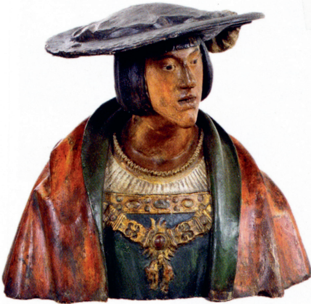
Karel V, keizer van het Habsburgse Rijk, de meest krachtige macht binnen Europa. Op deze buste draagt hij de keten van de Orde van het Gulden Vlies, in 1430 opgericht door Filips van Bourgondië.

In de loop van de veertiende en vijftiende eeuw vochten, kochten en huwelijkten Bourgondische hertogen zich vanuit hun erflanden in het oosten van Frankrijk een weg naar Noordwest-Europa. Het Bourgondische hof verplaatste zich van Dijon naar Brussel en Brugge. Dit gebied, een samenraapsel van staten en steden, viel na 1500 door de grillen van het erfrecht toe aan de Spaans-Habsburgse koning – een kolonie in handen van Spanje.