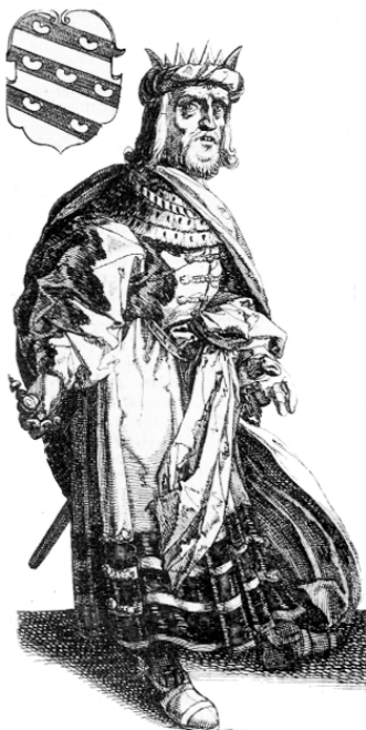
RADBODVS PRIMVS •

V An daer gæde na Nim- megen, alles vertoefende ende ver- derende wat inden woeghe was / heeft het selve gemalijcker wijse inghenomen/ ende dat enen trecken (sonder vtrooyt op tenen steen laten houten met dese wooyden/11vc