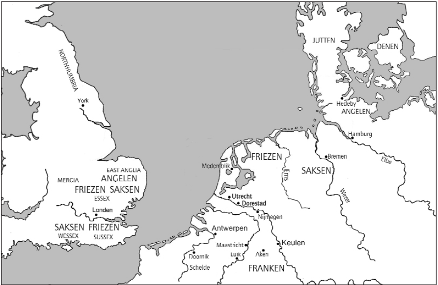
De Friese gebieden, hun burenen en hun Britse vestigingen.

schappen die hoofdzakelijk ook weer door waterstromen van elkaar gescheiden waren. De Eems is vanouds voor Friesland van grote betekenis geweest door zijn goede bevaarbaarheid. Deze omstandigheid maakte dit water tot een noord-zuidhandelsweg van de eerste orde.