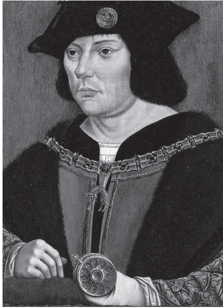
Willem van Croÿ (1458-1521). Olieverf op paneel, atelier Q. Matsys, 15e eeuw.