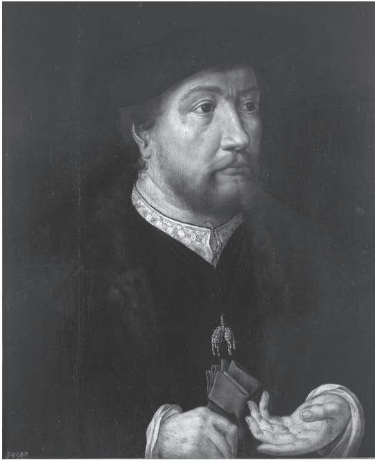
Hendrik III, graaf van Nassau. Schilderij (olieverf op paneel) Jan Gossaert, circa 1530.

cisca van Savoye, Claudia van Chalon en Mencia van Mendoza, markgravin van Cenette. Uit het tweede huwelijk met de in 1521 overleden erfdochter Claudia van Chalon werd zoon Renatus geboren, die onder meer het prinsdom Orange erfde. Hendrik III overleed op 14 september 1538 in Breda.