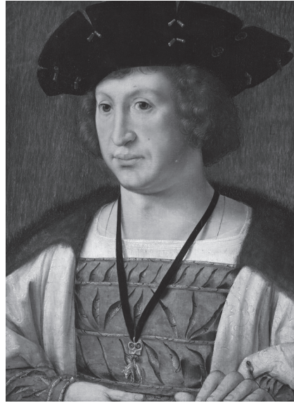
Floris van Egmont (1469-1539), graaf van Buren en Leerdam. Olieverf op paneel, Jan Gossaert, circa 1519.