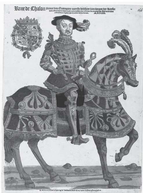
René (Rhenatus) van Chalon, prins van Oranje, graaf van Nassau, te paard. Houtsneede C. Anthonisz, circa 1543.

werd sindsdien veelal aangeduid als René van Chalon. Rhenatus verbleef al sinds zijn kinderjaren aan het hof van Karel V en werd in 1540 door Karel benoemd tot stadhouder van Holland, Zeeland, Friesland en Utrecht. In 1542 kwam daar nog het stadhouderschap van Gelderland bij. Rhenatus diende Karel V ook als militair, en overleed op 18 juli 1544 tijdens de belegering van Saint-Dizier, nadat hij de dag tevoren door een kogel was getroffen. Rhenatus had een bastaardzoon, Palamedes, maar uit zijn in 1540 gesloten huwelijk met Anna van Lotharingen waren geen kinderen geboren, zodat een wettige mannelijke nakomeling ontbrak. Nauwelijks een maand voor zijn overlijden had Rhenatus op aandrang van Karel V de oudste zoon van zijn oom Wilhelm van Nassau tot enige erfgenaam benoemd. Deze jongeman, ook Wilhelm geheten, deed vervolgens afstand van zijn rechten op het vaderlijk erfgoed in Nassau-Dillenburg en nam de titel van Prins van Oranje aan. 13 Als ‘Willem van Oranje’ zou hij uitgroeien tot ‘Vader des Vaderlands’.