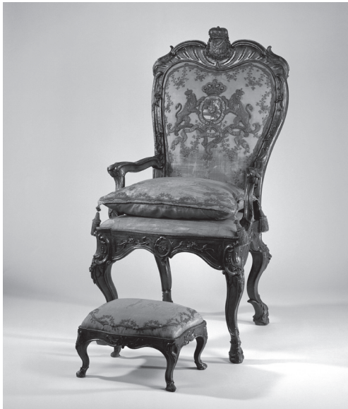
Stoel voor de erfstadhouder van Groningen, circa 1766-1767 vervaardigd voor prins Willem V. De stoel, afkomstig uit het Hof Provinciaal van Groningen, is op de bovendorpel voorzien van het gekroonde wapen van Groningen en op de rug is in reliëf het wapen van de Prins van Oranje en Nassau geborduurd. (Rijksmuseum, Amsterdam)

De overige hoofdstukken zijn gewijd aan de stadhouders in de Verenigde Nederlanden. In het Noorden, in de ‘Verenigde Provinciën’, bleef het stadhouderschap na de ‘verlating’ van Filips II bestaan, maar kreeg het heel nieuwe vormen en betekenissen. Aanvankelijk was niet duidelijk bij wie of wat de soevereiniteit berustte en wie de stadhouders in de diverse gewesten moest be-