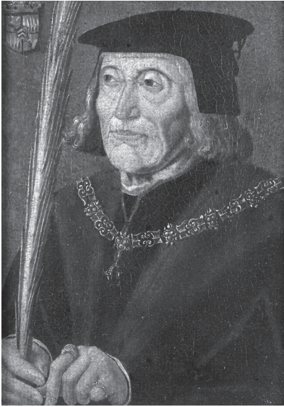
'Manke Jan': graaf Jan van Egmont (1438-1516). Olieverf op paneel, anoniem, circa 1510.