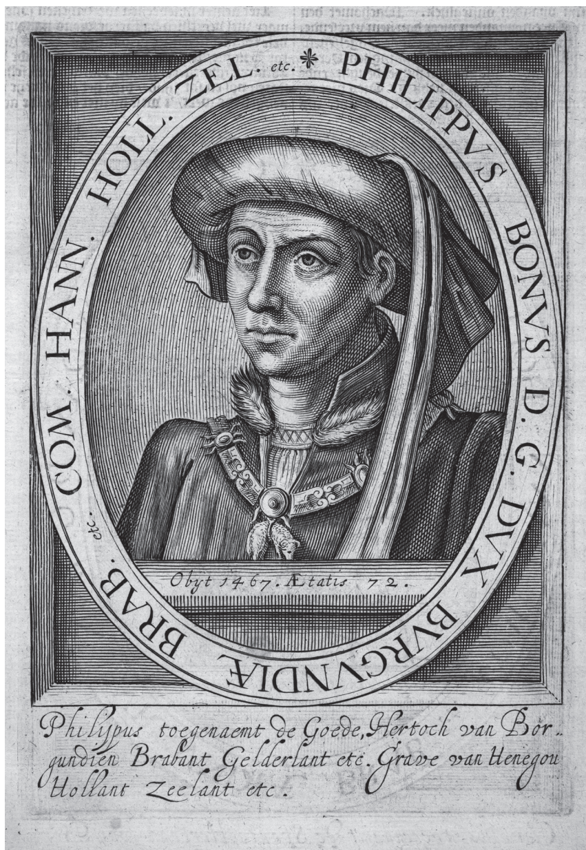
Filips III (1396-1467), bijgenaamd de Goede, hertog van Bourgondië, graaf van Holland en Zeeland, enz.