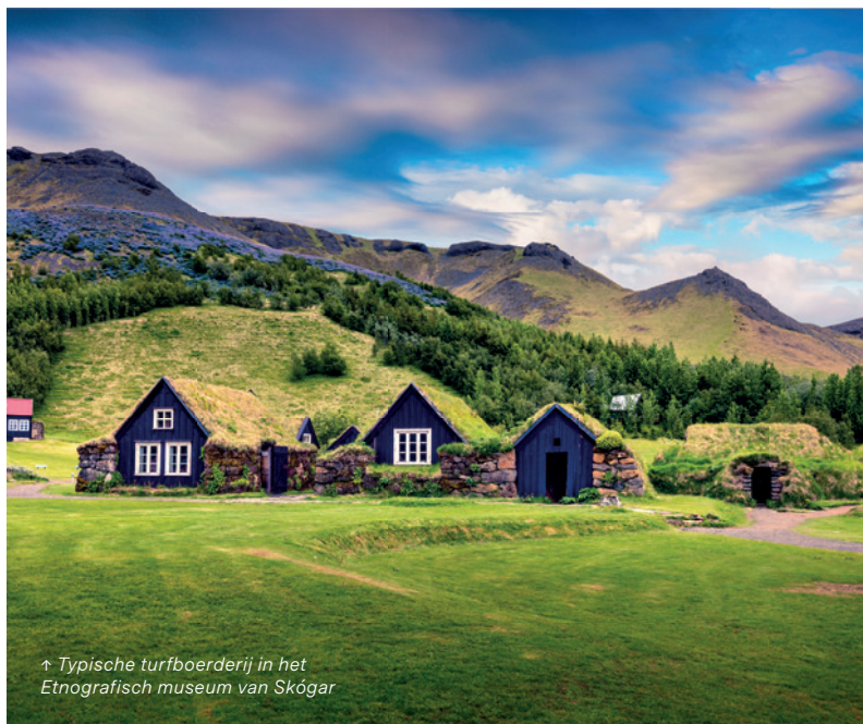
↑ Typische turfboerderij in het Etnografisch museum van Skógar