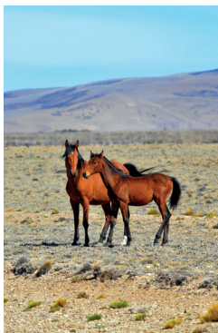
↑ De Argentijnse pampa