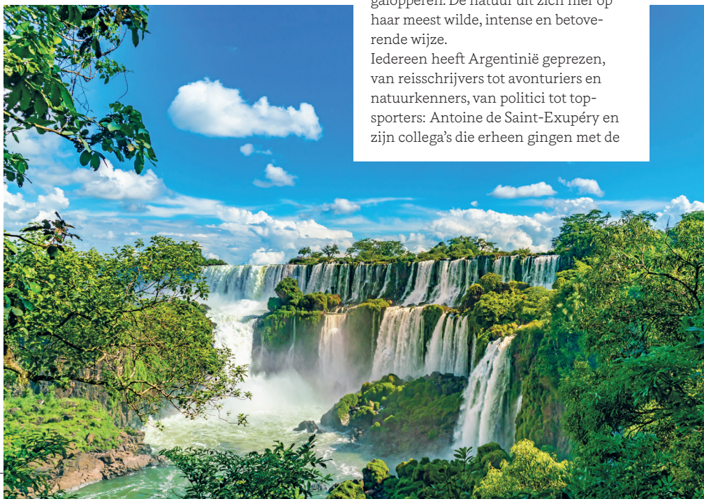
↓ Watervallen van Iguazú

Volg de contouren van Argentinië met je vinger op een wereldkaart en laat je meevoeren naar dat ultieme zuidelijke punt waar het Zuid-Amerikaanse continent uiteenvalt in eilanden aan de rand van de mythische Kaap Hoorn! Je kunt je het avontuur vast al voorstellen die een reis naar het einde van de wereld met zich meebrengt. Van de Steenbokkeerkring tot de woeste winden van de Furious Fifties, en van het diepe, zwarte water van de Atlantische Oceaan tot de blauwe meren van Patagonië; de Argentijnse natuur heeft een heel bijzondere kracht waardoor de het een dramatische dimensie krijgt. De minerale schoonheid van de Andes, het duizelingwekkende neerstorten van de watervallen van Iguazú, de oorverdovende stilte van de Patagonische kanalen, het oneindige oppervlak van de pampa's dat trilt als de guachos er met hun paarden overheen galopperen. De natuur uit zich hier op haar meest wilde, intense en betoverende wijze.