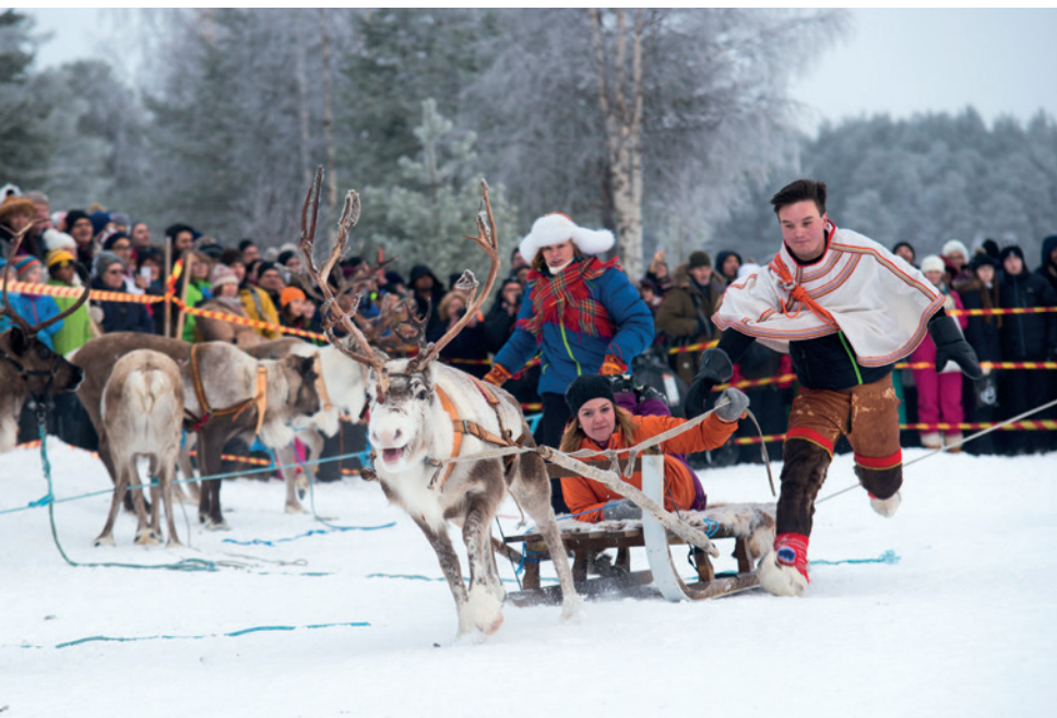
↑ Rendierenrace in Jokkmokk

monotoon zou kunnen noemen. Om het allemaal wat op te vrolijken, zijn er grote dynamische steden met een leuke charme, heel wat geschiedenis, maar ook een moderne kant, in voor- en tegenspoed.