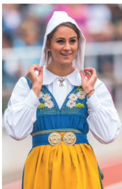
↑ Traditionele klederdracht

Denemarken en Zweden zijn buren en delen een geschiedenis , maar zijn toch duidelijk twee verschillende landen. Eerst en vooral is er de omvang en de geografie, maar er is ook de openheid van de bevolking naar de wereld toe. Zweden is bijna zeven keer groter dan België en Nederland samen, maar er wonen bijna drie keer minder mensen. Ruimte genoeg dus voor iedereen, waardoor respect voor de medemens hier geen loze uitroep is gebleven. Wie Zweden zegt, zegt harmonie tussen mens en natuur, absolute rust en een kalm leven, dat je op een slechte dag