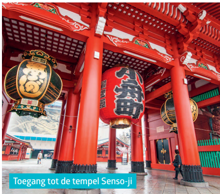
Toegang tot de tempel Senso-ji