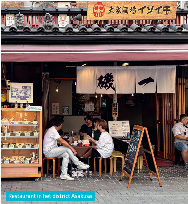
Restaurant in het district Asakusa

| 5-26-6 Ueno, Katsura Building B1, Taito-ku | Di.-za. 11.30-8.00 u, zo. 12.00-1.00 u, ma. 18.00-2.00 u | ¥ 280-12.000.