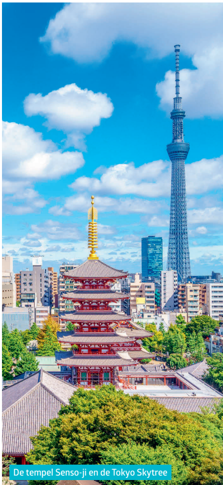
De tempel Senso-ji en de Tokyo Skytree

De 'elektronicawijk' is een paradijs voor fans van de Japanse popcultuur , gamers, geeks en andere otaku , de obsessieve fans van videospellen, manga's en anime. De neonlampen van de elektronica- en computerwinkels flikkeren en op de achtergrond weerklinkt een kakofonie van jingles.