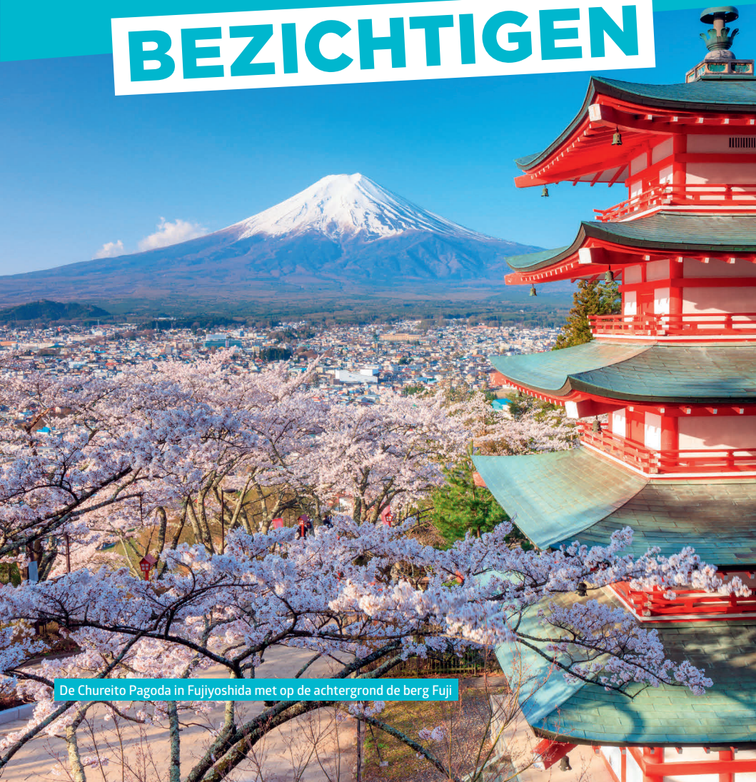
De Chureito Pagoda in Fujiyoshida met op de achtergrond de berg Fuji