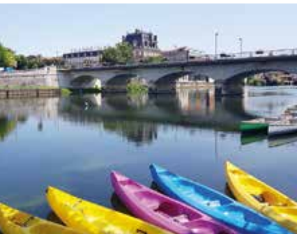
De Charente bij Jarnac