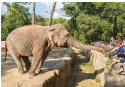
Een olifant in de Zoo de La Palmyre

Ga eerst naar de grotten bij Meschers (blz. 238), dan naar Talmont, voor de bijzondere kerk op een klif (blz. 236), en tot slot naar de haven van Mortagne (blz. 240).