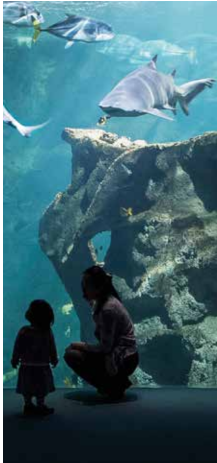
Haaien in het Aquarium in La Rochelle