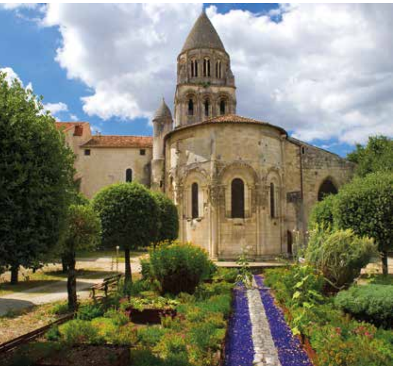
De Abbaye-aux-Dames in Saintes

♥ Maak een drie-dimensionale muziekkreis door de Abbaye-aux-Dames in Saintes, een schitterende abdij in de romaanse stijl van de Saintonge. Een belevenis om nooit te vergeten! Zie blz. 254.