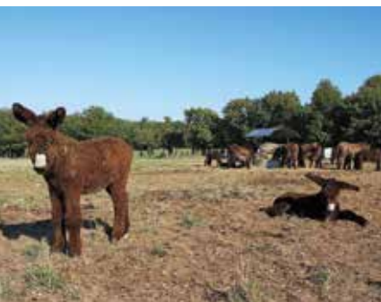
De ezelhouderij in Dampierre-sur-Boutonne

In de miniatuurhaven van Saint-Savinien liggen een stuk of twintig fluisterbootjes op je te wachten. Maar niet zomaar bootjes! Het zijn