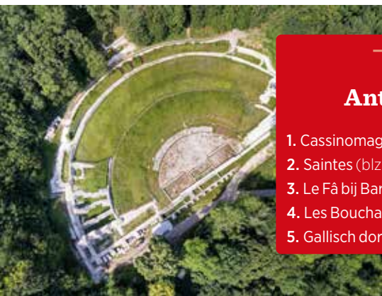
Het Gallo-Romeinse theater in Les Bouchauds