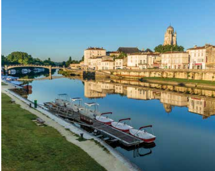
Uitzicht op Saintes, dat zich spiegelt in de Charente

Musicaventure , een geheel van diverse, elkaar aanvullende experiences (of modules): de Voyages Sonores , een bezoekersroute door de abdij, de kloostergebouwen en de hoogste delen van de klokkentoren met een 3D-surround koptelefoon (de 'Voyage initiatique' benadert de geschiedenis van het complex aan de hand van de muziek, voor het 'Parcours héroïque' is gekozen voor een chronologische benadering – inbegrepen in het entreeticket – duur 1 uur/1.15 uur ); de klassieke audiotour in 17 afleveringen met gedetailleerde informatie over de geschiedenis en de architectuur van de abdij ( inbegrepen in het entreekaartje – duur 1.30 uur ); de Siestes Sonores bieden je de gelegenheid om lekker languit op een ligstoel met een stereo hoofdtelefoon de grote concerten van het festival te beluisteren ( op afspraak, afhankelijk van de agenda – inbegrepen in het toegangskaartje – duur 40/50 min. ); de Carrousel Musical (zie blz. 256); de Odysée, le Défi , een stadsavontuur dat eindigt in de digitale studio's van de abdij (zie blz. 256). De winkel, tot besluit, is gespecialiseerd in romaanse kunst en barokmuziek.