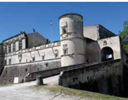
Het Château de Bouteville J.-M. Mulon/Michelin