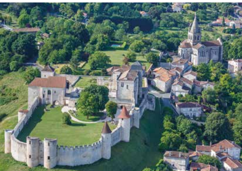
Villebois-Lavalette en zijn kasteel