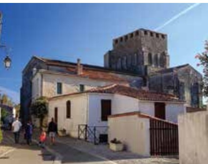
Een straatje in Mornac-sur-Seudre

♥ Proef vers gevangen oesters en vis in het pittoreske haventje van Mornac-sur-Seudre en maak daarna een wandeling naar de zoutpannen, met een zoutwerker als gids, of door de fleurige straatjes van Mornac, een van de 'Mooiste Dorpen van Frankrijk'. Zie blz. 224.