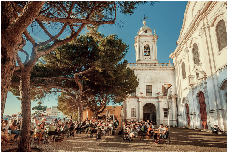
Geniet van het uitzicht aan de Miradouro da Graça, of Miradouro Sophia de Mello Breyner Andresen

♥ Breng een avond door in de hippe buurt rond de Praça do Príncipe Real, met de vele boetieks en restaurants met hun chique interieur en verleidelijke menukaart. 📍 blz. 41, 106 en 114.