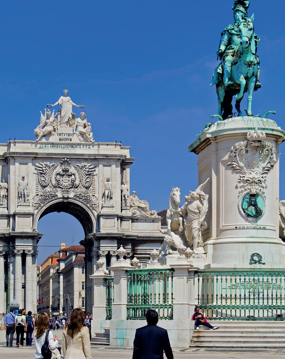
De monumentale Arco da Rua Augusta staat aan de Praça do Comércio.