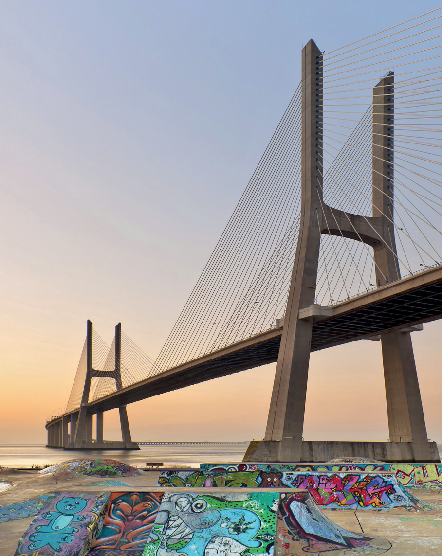
De lange Ponte Vasco da Gama is een prachtig staaltje architectuur.