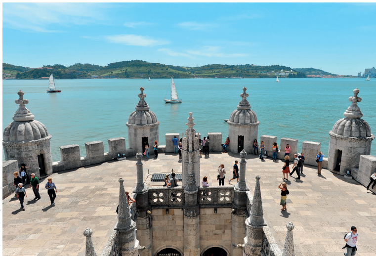
Uitzicht op de Taag vanaf de Torre de Belém