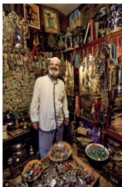
↑ Marokko staat bekend om zijn gastvrije bevolking.