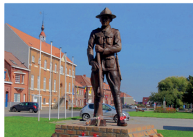
Mesen, New Zealand Soldier