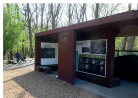
Toegangspoort The Bluff