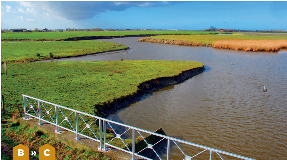
De watergeulen in het Oostendse krekengebied zorgen voor een uniek uitzicht.

belangrijk broedgebied voor de rietgors, blauwborst en karekiet. Door het authentieke polderlandschap achter de kustlijn fiets je daarna tot bij de Plassendalevaart in Snaaskerke.