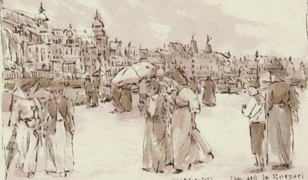
GÖTTINGEN. — Devant le Kopsael