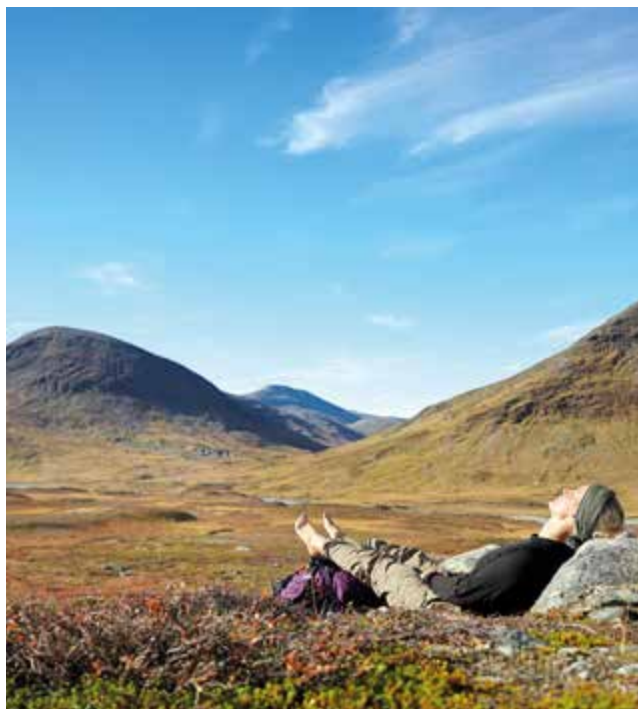
Geen wandeling zonder een pauze – hier bij de Kebnekaise