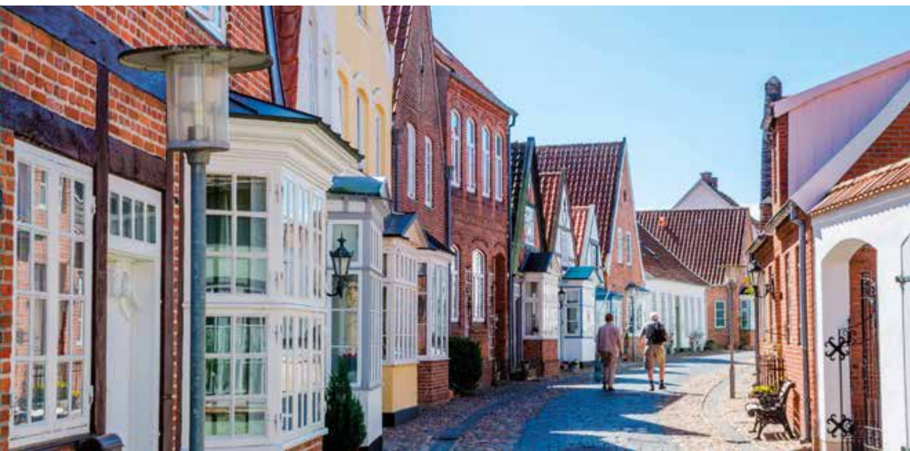
Bij een wandeling door het stadje Tønder springen overal de vele fraaie bakstenen huizen in het oog.

Jutland (Deens Jylland ) is zeer divers. Het oosten wordt gekenmerkt door welvarende steden, het westen, dat aan de ruige Noordzee grenst, door vissersdorpen. Noord- en Midden-Jutland, de culturele centra van het land, pakken uit met bezienswaardige kastelen, kloosters en kerken.