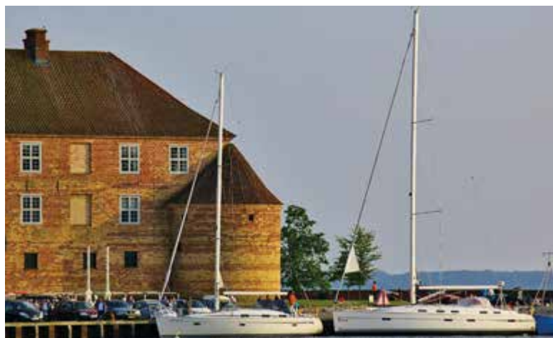
Jachten schommelen op het water in de schaduw van het Sønderborg Slot.

gotische Klosterbagerens Hus, het barokke stadhuis en de Gamle Apothek uit de 17de eeuw. Het interieur van de in 1592 gewijde Kristkirke imponeert met verfijnd houtsnijwerk. Het poortgebouw van het in 1750 gesloopte kasteel herbergt nu het Tønder Museum, dat een opmerkelijke verzameling