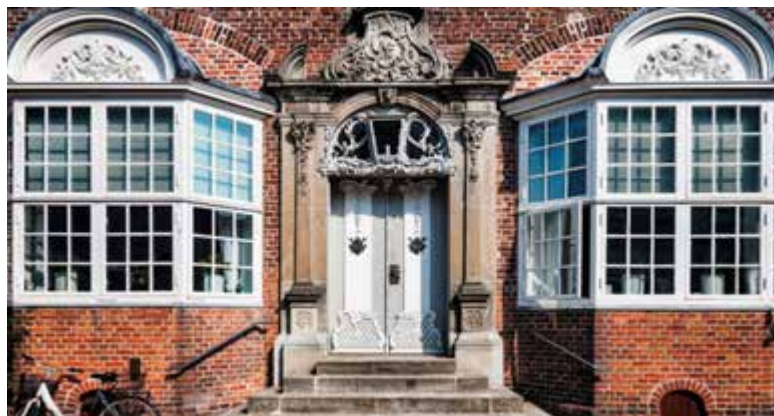
De glans van lang vervlogen tijden leeft voort in de architectuur van Tønder.

Dit leuke stadje op luttele kilometers van de Duits-Deense grens lokt bezoekers met een schilderachtig historisch centrum en tal van winkelmogelijkheden. Tønder kan terugkijken op een bewogen verleden. In de middeleeuwen was de stad het belangrijkste handelscentrum van de regio, gezegend met een directe toegang tot de zee via de rivier de Vidå. Toen de verzanding van de haven door de bouw van een dijk in de 16de eeuw de economische neergang inluidde, schakelden de kooplieden van Tønder over op de handel in kantwerk. Dat legde de stad in de 17de en 18de eeuw geen windeieren. De vele goed bewaarde patriciërshuizen in het voetgangersgebied getuigen tot op heden van de rijkdom die de lokale handelaars vergaarden met de verkoop van kant, die door duizenden thuiswerkende kantwerksters moeizaam werd vervaardigd. Het hart van het oude Tønder klopt nog altijd op het marktplein, de torvet . Blikvanger op het plein is een houten figuur die met een zweep zwaait. Afgebeeld is de kagmand (gerechtsdienaar), die tot diep in de 19de eeuw in vele steden in Noord-Europa als waarschuwing voor de burgers naast de schandpaal of kaak geplaatst werd. Het beeld is een kopie. De originele kagmand van Tønder is vandaag te bewonderen in het Tønder Museum (stedelijk museum). Rond de torvet scharen zich imposante historische gebouwen zoals het laat-