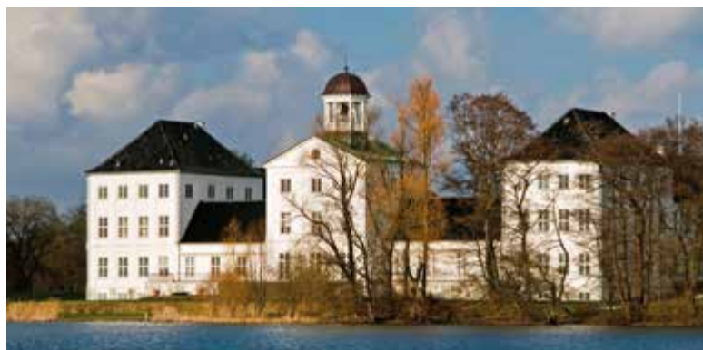
Het Gråsten Slot is de zomerresidentie van de Deense koninklijke familie.