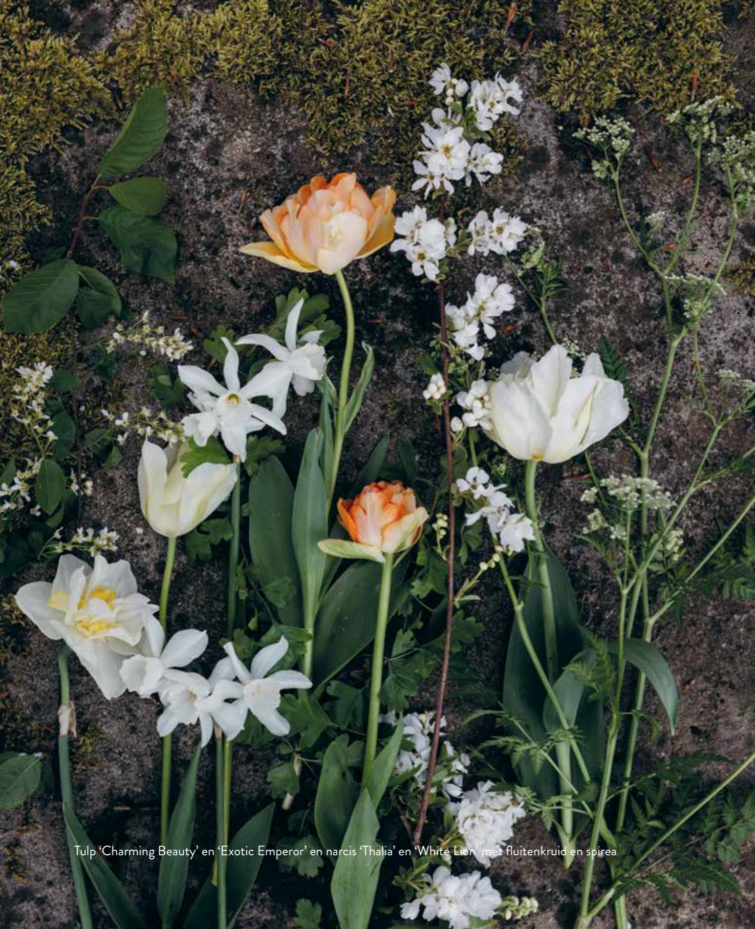
Tulp 'Charming Beauty' en 'Exotic Emperor' en narcis 'Thalia' en 'White Lion' met fluitenkruid en spirea