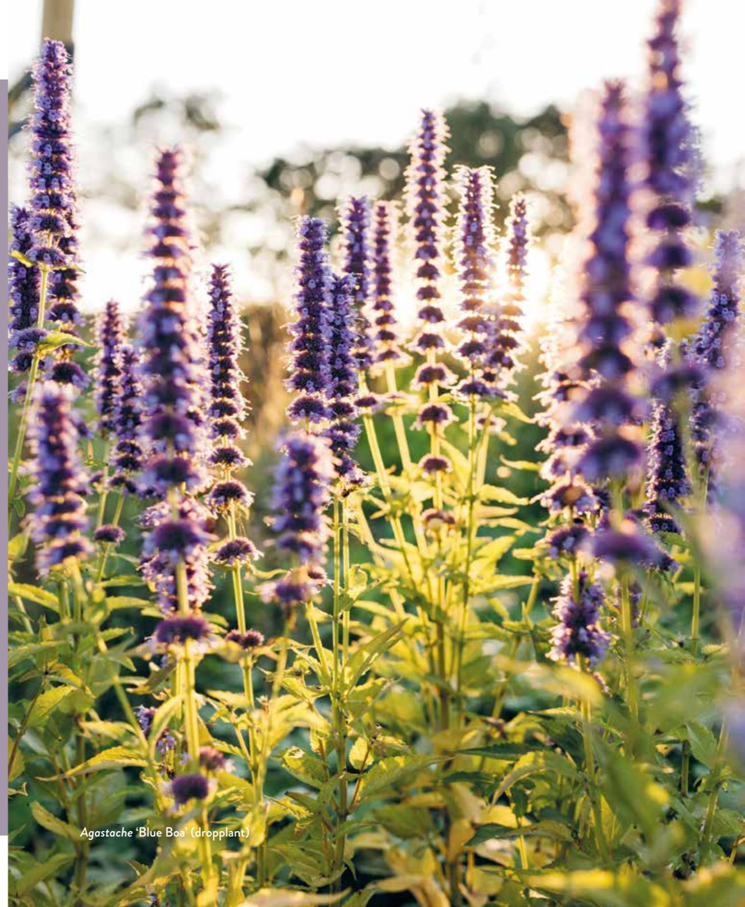
Agastache 'Blue Boa' (droplant)

In de zomer is er soms zo veel te kiezen dat we het overzicht verliezen. En er is ook veel moois; daaruit moet je eigenlijk gewoon een selectie maken die onmisbaar is. Dit zijn wat mij betreft de onmisbare vaste planten voor het zomerseizoen.