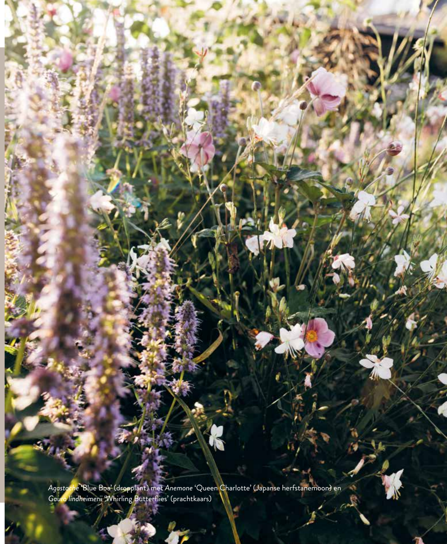
Agastache 'Blue Boa' (dropplant) met Anemone 'Queen Charlotte' (Japanse herfstanemoon) en Gaura lindheimeri 'Whirling Butterflies' (prachtkaars)

Om te verduidelijken hoe de lagentheorie in een beplantingsplan toegepast kan worden, laat ik je een voorbeeld zien. Dit voorbeeldplan komt in dit boek per seizoen terug, zodat je kunt zien hoe de border er door het jaar heen uitziet. In elk seizoen is er namelijk iets anders dat in bloei staat en dus opvalt. Zo leer je herkennen welke verdeling je nodig hebt om daadwerkelijk gedurende het hele jaar een bloeiende tuin te creëren.