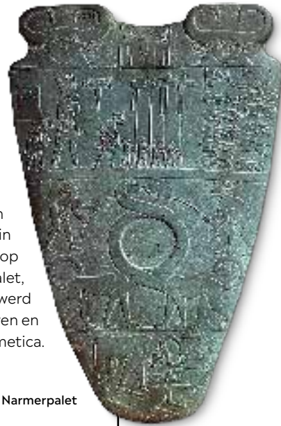
▷ Het Narmerpalet

De twee koninkrijken van Opper- en Neder-Egypte worden verenigd door Narmer (ook bekend als Menes), die de eerste dynastie stichtte en de eerste farao was van de vroegdynastieke periode. Zijn verhaal werd vastgelegd in beelden en hiërogliefen op voorwerpen als het Narmerpalet, een versierd tablet dat werd gebruikt bij het verpulveren en mengen van cosmetica.