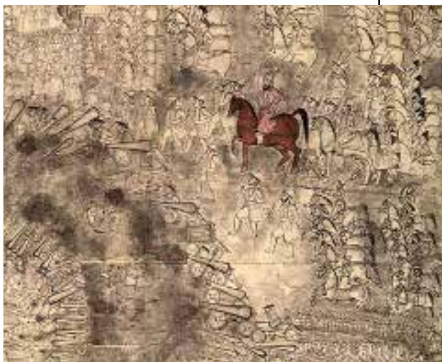
△ Derde Slag bij Panipat in Noord-India

1760 Tacky's Oorlog was een grote slavenopstand op Jamaica die met veel geweld werd neergeslagen