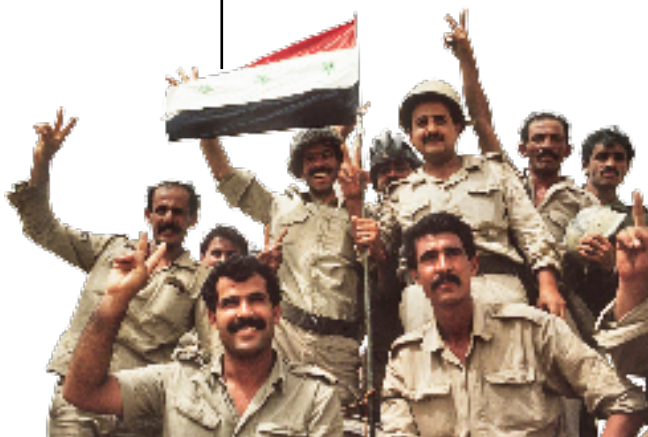
△ Iraakse soldaten in een overwinningroes

3 november 1992 Bill Clinton wordt gekozen tot 42ste president van de VS