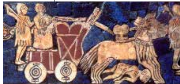
△ Sumerische strijdwagen op de Standaard van Ur

In Mesopotamië werden steeds grotere dieren gedomesticeerd, zoals runderen en ezels, die door boeren werden ingezet om akkers te ploegen of karren te trekken. De Sumeriërs bouwden karren met houten wielen, speciaal voor de landbouw. Niet lang daarna werden er ook militaire en ceremoniële wagens ontworpen, gemodelleerd naar de boerenkarren.