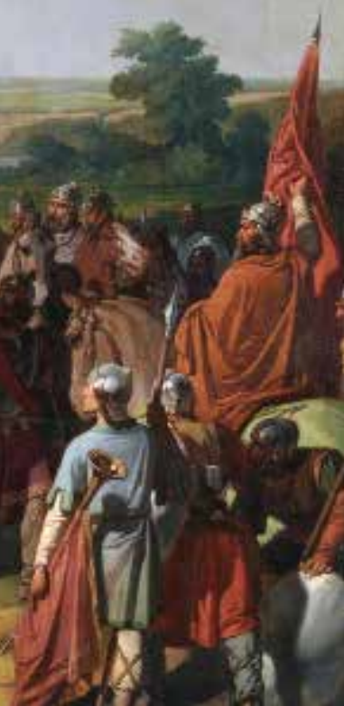
△ De Slag bij Guadalete

751 n.C. Een Arabisch leger van het Abbasidenkalifaat verslaat de Chinese Tang bij de Slag om Talas