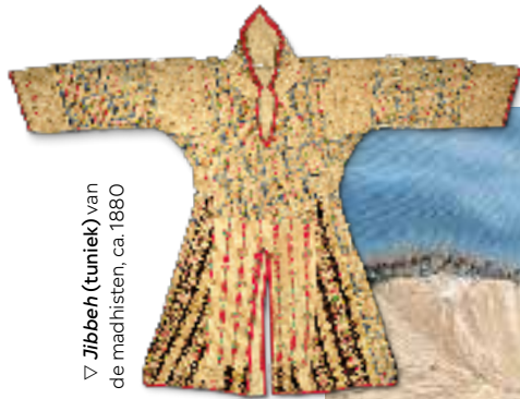
▽ Jibeh (tuniek) van de mahdisten, ca. 1880