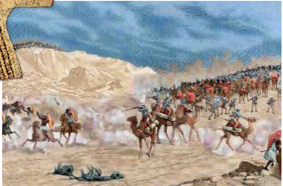
△ Het leger van de mahdisten vecht tegen de Britten

In 1881 roept de islamitische geestelijke Muhammad Ahmad zichzelf uit tot Mahdi (verlosser) en leidt een opstand tegen Egypte, dat sinds 1819 over Soedan heerst. In 1883 verslaan de mahdisten Egyptische en Britse troepen bij El Obeid. Khartoem valt in 1885 in handen van de mahdisten.