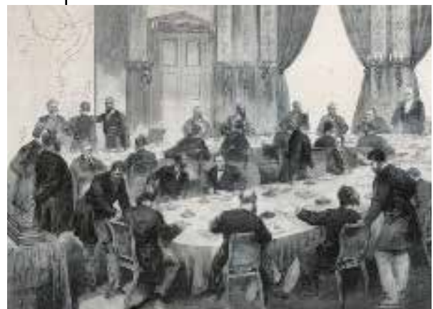
△ Afgevaardigden op de Conferentie van Berlijn

Op 20 mei 1883 barstte de Krakatau, tussen Java en Sumatra, voor het eerst in twee eeuwen uit. In augustus volgde een reeks van vier explosies die het vulkanische eiland vrijwel verwoestte. Bij de erupties kwamen enorme hoeveelheden as vrij en er volgde een tsunami. 36.000 mensen kwamen om.