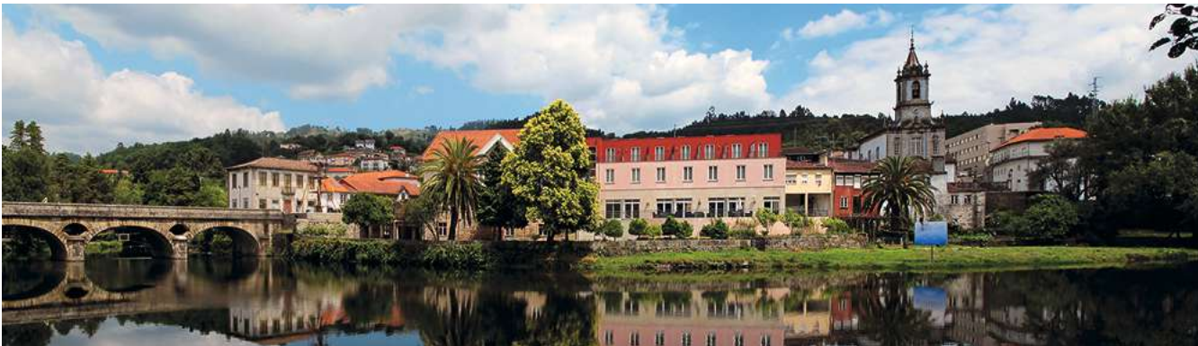
Arcos de Valdevez, gelegen aan de mooie Rio Vez, bezit een verbazingwekkend aantal kerken.

tot november elke avond een folkloristisch schouwspel plaats: in de Quinta do Santoinho kunnen gasten voor een vaste prijs eten en drinken zoveel ze willen: er zijn gegrilde sardientjes, maisbrood en wijn. En na de muziek en dans volgt als afsluiter de koolsoep caldo verde – een heerlijk en overdadig met alcohol overgoten spektakel!