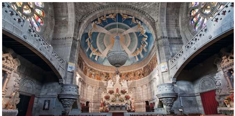
Schitterende plafondschilderingen in de basiliek van Viana do Castelo

direct gevecht en lieten hun ridders het in een toernooi tegen elkaar opnemen. Aangezien de mannen van Afonso Henriques zegevierden, werd hij voortaan beschouwd als koning van Portugal. Een zuil in de bovenstad herdenkt deze overwinning. Indrukwekkend is ook de mannelijke schandpaal of pelourinho voor de parochiekerk van het stadje. Tegen het barokke godshuis leunt een sierlijke rococokapel uit 1765. Als toegangspoort tot het nationaal park Peneda-Gerês is Arcos de Valdevez ook van groot toeristisch belang.