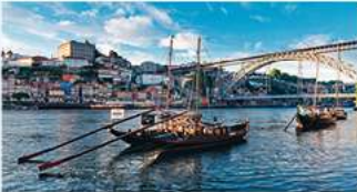
2 Porto Haar ligging op een helling aan de monding van de Douro en imposante bruggen maken de culturele hoofdstad van Europa 2001 onvergetelijk. De meeste portwinkelders bevinden zich in de tegenovergelegen stad Vila Nova de Gaia.