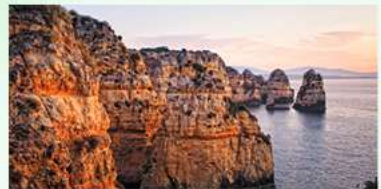
4 Algarve De bekendste en drukst bezochte landstreek is vermaard om haar eigenaardige rotskust met heerlijke zandbaaien en aangenaam klimaat. De waterkwaliteit wordt eveneens geroemd.