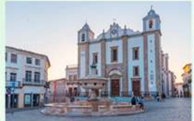
3 Évora Imposante pleinen, paleizen en kerken maken de stad tot de mooiste van Alentejo, de grootste Portugese provincie.