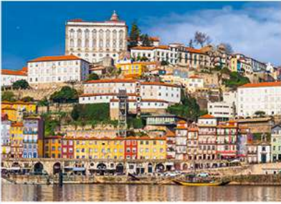
1 Coimbra Fadozaaltjes, de grootste romaanse kerk van Portugal en een uniek koninklijk paleis kenmerken de universiteitsstad.