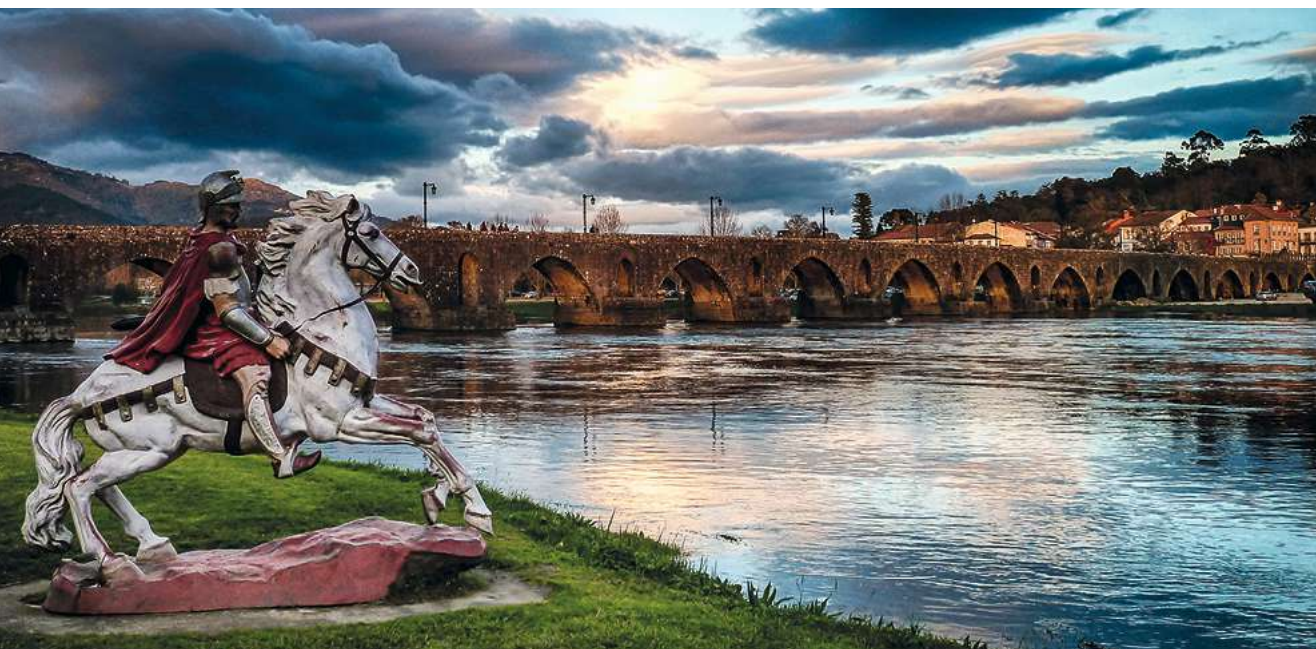
Ponte de Lima is een van de oudste steden van Portugal.

De rivier die haar naam gaf aan de regio drukt haar stempel op het landschap van de historische provincie en staat bij wijnliefhebbers bekend als plaats van herkomst van de vinho verde , een lichte, sprankelende witte wijn. Dit grensgebied was vaak de inzet van hevige gevechten. Getuige daarvan zijn de vele overgebleven vestingen in de streek.