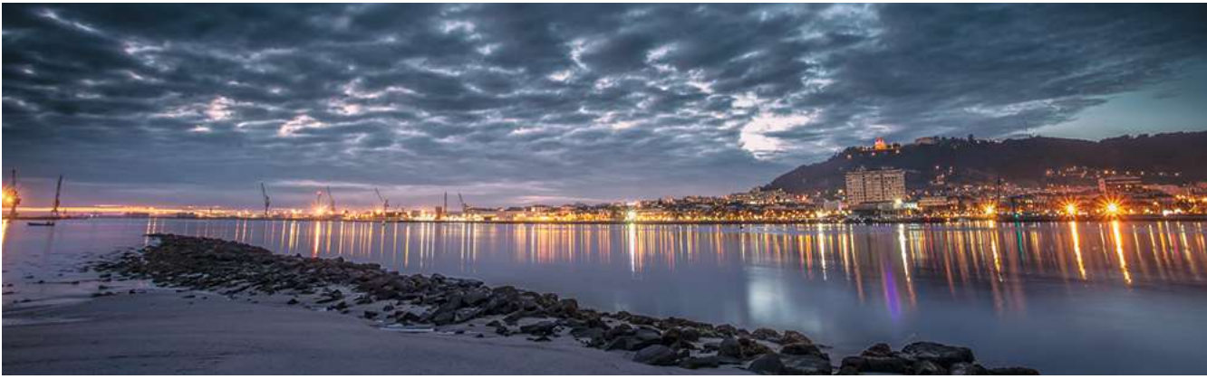
De prachtige stad Viana do Castelo ligt aan de monding van de Lima.