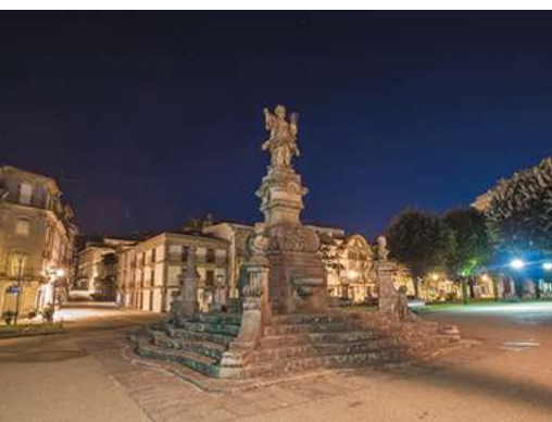
Het centrum van Viana do Castelo

De Minho vormt over een afstand van 80 km de grens tussen Portugal en Spanje en leent haar naam aan de historische provincie. Wijnliefhebbers kennen Minho als plaats van herkomst van de vinho verde , een sprankelende witte wijn die in het uiterste noorden van het land van topkwaliteit is. Om het grensgebied werd vaak hevig strijd geleverd, dat bewijzen de met imposante vestingen versterkte stadjes. Een daarvan is Valença do Minho, waar in de 17de eeuw een stervormig renaissancebastion omheen werd gebouwd. Een ander is het verder oostwaarts gelegen Monção. In alle dorpen aan de Minho nodigen quintas uit tot het proeven van de vinho verde , die uitstekend past bij de tweede culinaire specialiteit van de streek, de lamprete genoemde zalmforel.