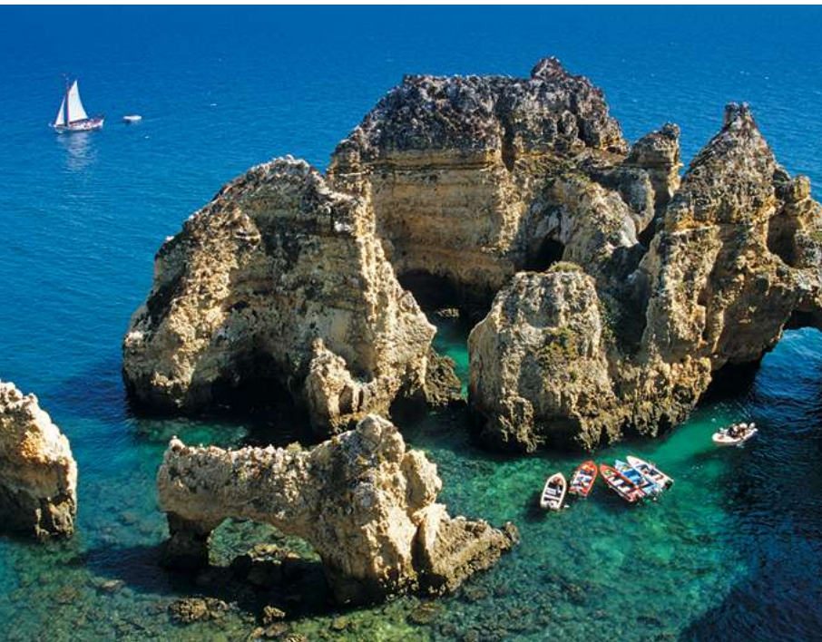
Bij de Ponta da Piedade vertrekken bootjes naar de kleine grotten.