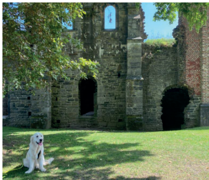
Noem de Abdij van Villers-la-Ville (12) gerust een verborgen pareltje in Waals-Brabant.