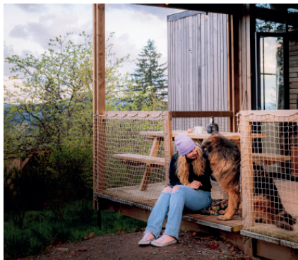
Disconnect, back to basics and slow living, dat kan bij Nutchel in Martelange (18 Attent).