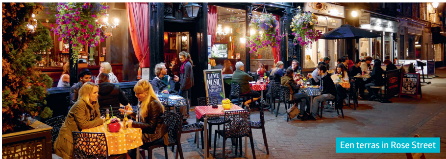
Een terras in Rose Street

| Dag. 12.00-14.30 u en 17.30-21.00 u | Gerechten £ 9-22.