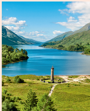
Glenfinnan Monument Bewonder Loch Shiel en het beroemde viaduct.