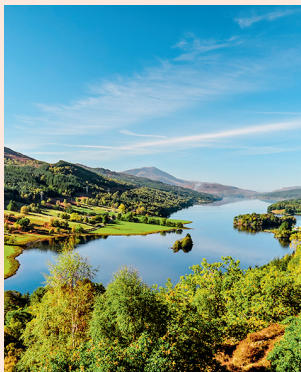
Queen's View Geweldig panorama op Loch Tummel