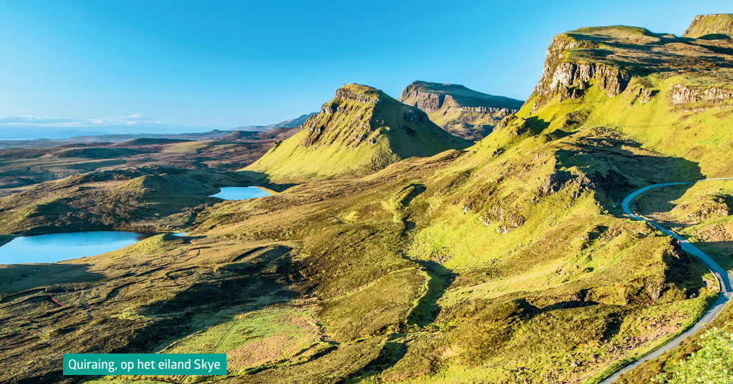
Quiraing, op het eiland Skye