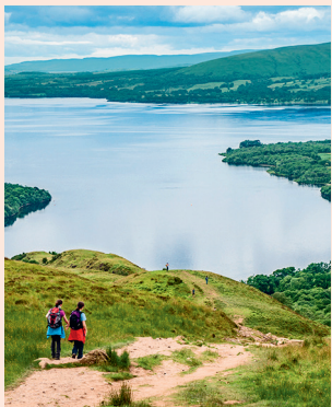
Conic Hill Makkelijk toegankelijk, uitzicht op Loch Lomond