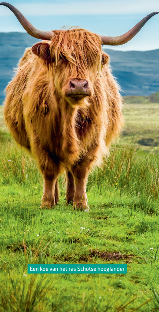
Een koe van het ras Schotse hooglander