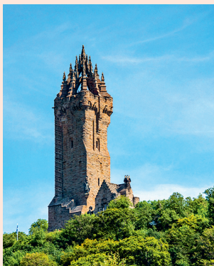
National Wallace Mon. Onder de toren ontvouwt zich de vlakte van Stirling.