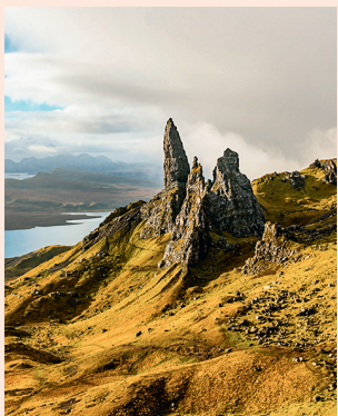
The Old Man of Storr Uniek uitzicht op het westen van Skye