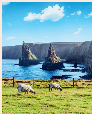
Duncansby Head Kliffen en twee spectaculaire rotspieken