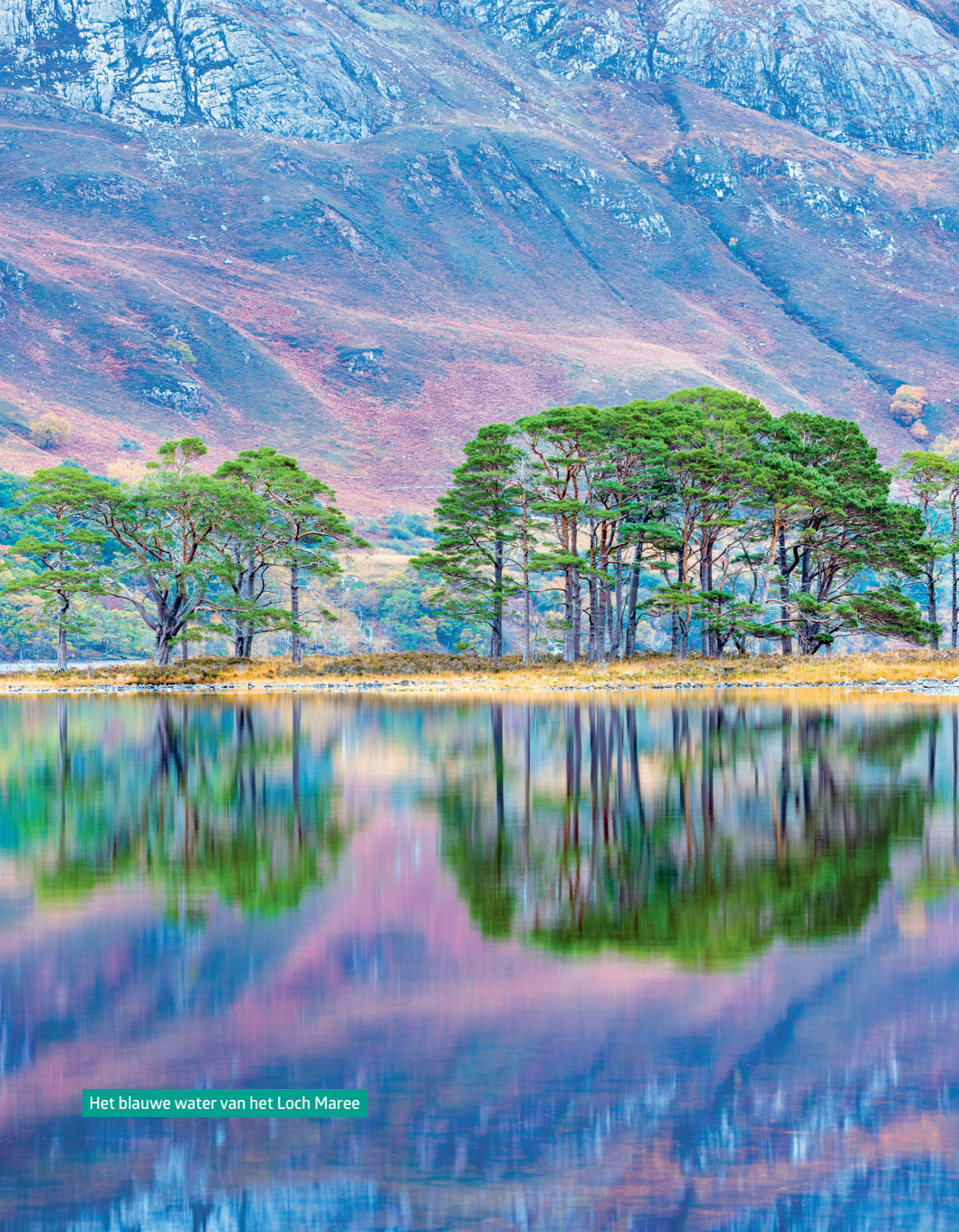
Het blauwe water van het Loch Maree