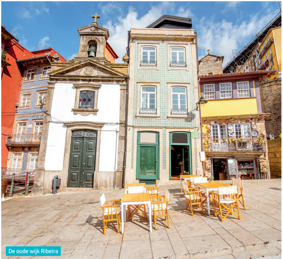
De oude wijk Ribeira

Vanaf de kathedraal, boven op de heuvel in de oude, tot Unesco Werelderfgoed uitgeroepen volkswijk Ribeira, daal je met een brede glimlach af naar de levendige oevers van de Douro.