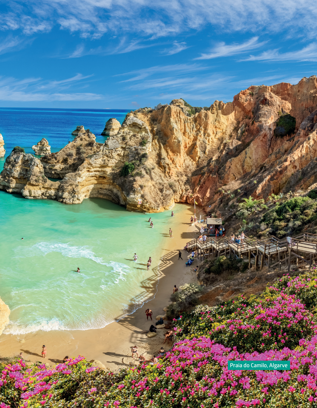
Praia do Camilo, Algarve