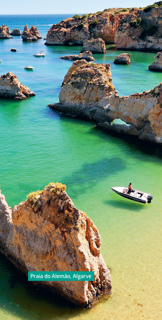
Praia do Alemão, Algarve