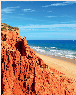
Praia da Falésia Met daarachter een lange rij okerkleurige kliffen