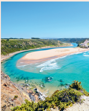
Praia de Odeceixe Origineel strand, tussen de rivier en de oceaen