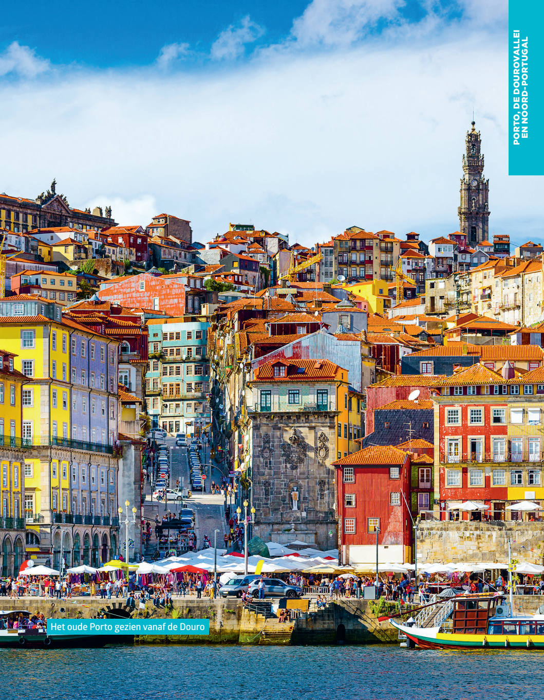
Het oude Porto gezien vanaf de Douro