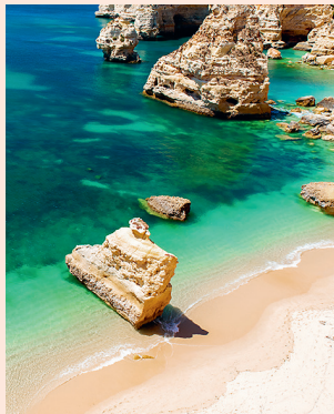
Praia da Marinha Wit zand, helder water, goudkleurige rotsen