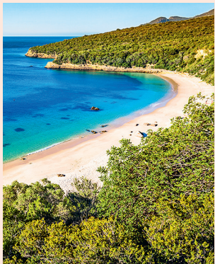
Portinho da Arrábida Mediterraan strand aan de Atlantische Oceaan