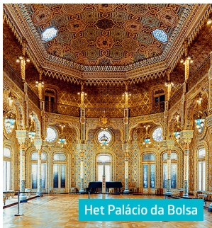
Het Palácio da Bolsa

Weelderig neoclassicistisch paleis (19de eeuw), ooit het beursgebouw , met onder andere de Arabische salon, geïnspireerd op het Alhambra in Granada. | April-okt.: dag. 9.00-18.30 u, nov.-maart: dag. 9.00-13.00 u en 14.00-17.30 u.