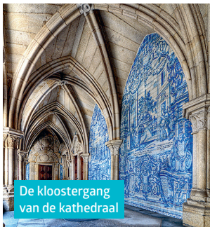
De kloostergang van de kathedraal