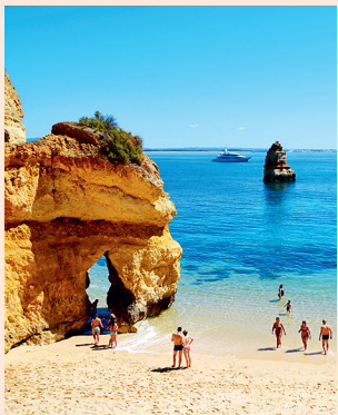
Praia de Dona Ana en praia do Camilo Droombaaieren