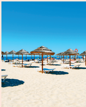
Praia da Ilha de Tavira Kilometerslang strand op het eiland Tavira