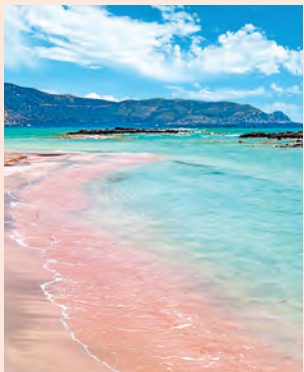
Elafonissos Een roze strand en laguneachtige krekten.