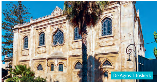
De Agios Titoskerk

De 5 km lange muren met zeven bastions beschermden ooit de oude stad, vooral tijdens de 21 jaar durende bezetting in de 17de eeuw. Boven op het bastion Martino zie je het graf van de schrijver Kazantzakis.