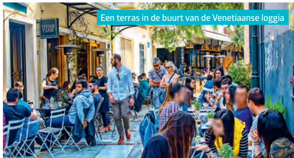
Een terras in de buurt van de Venetiaanse loggia

| Handakos 51 | Dag. 9.00-2.00 u | € 5-8.