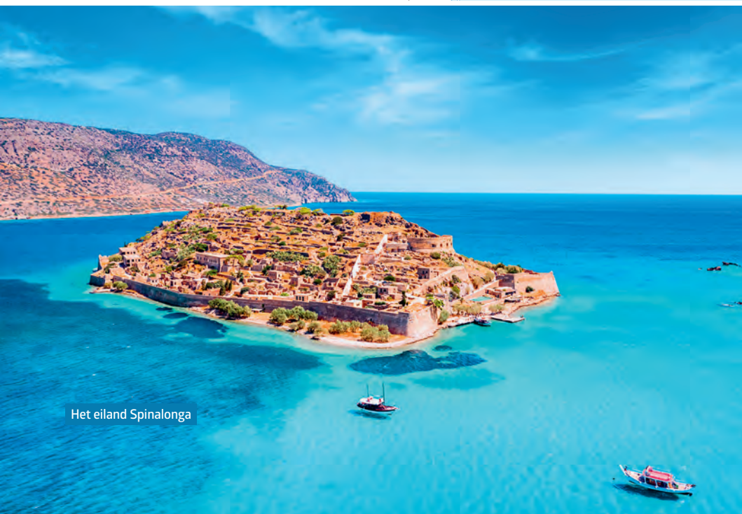
Het eiland Spinalonga