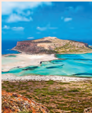
Balos Een magnifieke lagune bij een goudgeel strand.