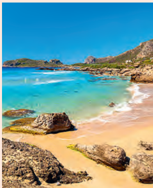
Falassarna Hier wachten je magische zonsondergangen.