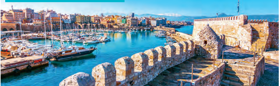
Het Venetiaanse fort en de haven van Heraklion

Auto: 20 minuten vanuit het centrum of 15 minuten vanaf de luchthaven.