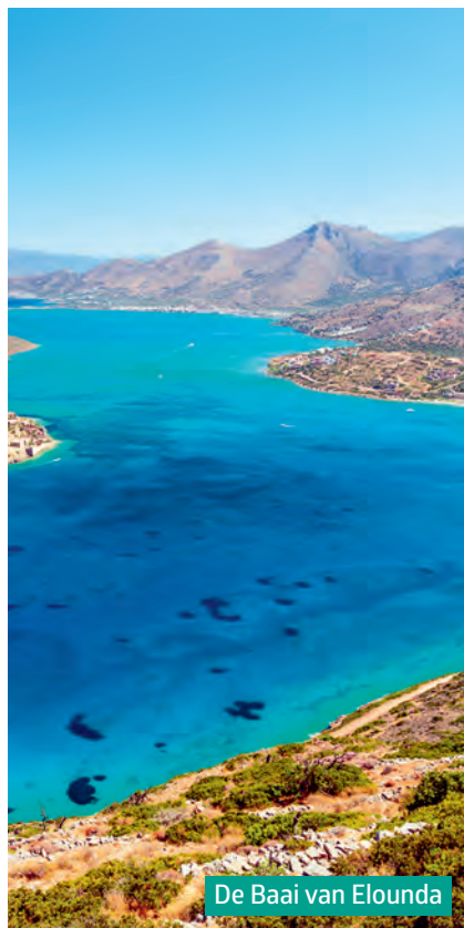
De Baai van Elounda